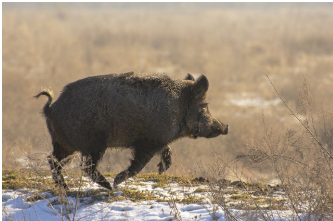
Рис. 5. Фотоконкурс «Свина та її родичі в об'єктиві»: зліва — Сергій Козодавов та учасники Школи біля фотостенду; справа — ланенятко, фото Тетяни Турейської; знизу — кабан, фото Сергія Козодавова.