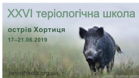
Рис. 1. Логотип та пам'ятна наклеїтка 26 Теріошколи (острів Хортиця, 17–21.06.2019).