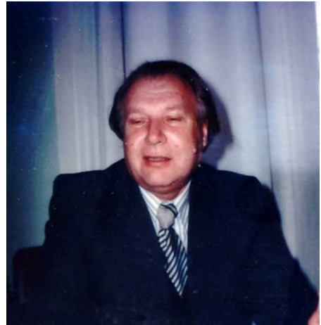
Рис. 1. Вадим Топачевський. Фото близько 1985 року, з архіву ННПМ.

Праці молодого науковця досить швидко набувають популярності як у ближніх, так і віддалених, зокрема й за межами СРСР, наукових колах. Вадим Олександрович стає одним із провідних палеотеріологів колишнього СРСР. У 1969 році у головному на той час видавництві «Наука» в серії «Фауна СРСР» було опубліковано фундаментальне монографічне зведення вченого, присвячене родині сліпакових ( Spalacidae ), при тому одночасно детальному аналізу сучасних і вимерлих форм в усьому їхньому різноманітті. Книга стала одним з найбільш цитованих видань, підготовлених дослідником (Топачевський 1969). За два роки за цю працю йому було присуджено науковий ступінь доктора біологічних наук. Згодом монографія була видана англійською мовою Смітсонівським інститутом (Topachevskii 1976) 1 .