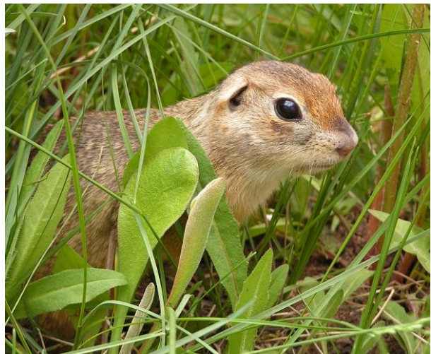
Рис. 5. Ховрахи України: ховрах подільський, Spermophilus odessanus , з Одещини та ховрах сирій, або малий, Spermophilus pygmaeus , з Донеччини.