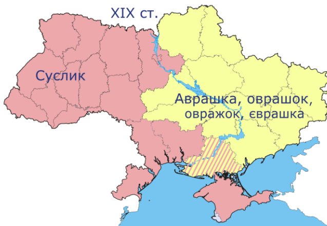
Рис. 4. Географічні ареали двох основних груп вернакулярних назв ховрахів, відомих у працях XIX ст. стосовно України. Згодом, у працях XX ст. спостерігається панування в Україні спочатку назви «ховрашок», а згодом «ховрах»; на заході та півдні місцями зберігся номен «суслик».