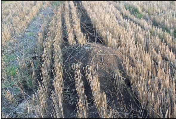
Рис. 2. Курганчик на стерні після колоскових зернових.