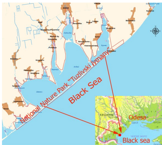
Рис. 1. Картосхема розташування територій та акваторій НПП «Тузлівські лимани».

Знайдені поселення реєстрували на картосхемі Парку (рис. 2). На території Парку за період досліджень ми виявили 2 поселення шакала, нори яких були вириті ними самостійно.