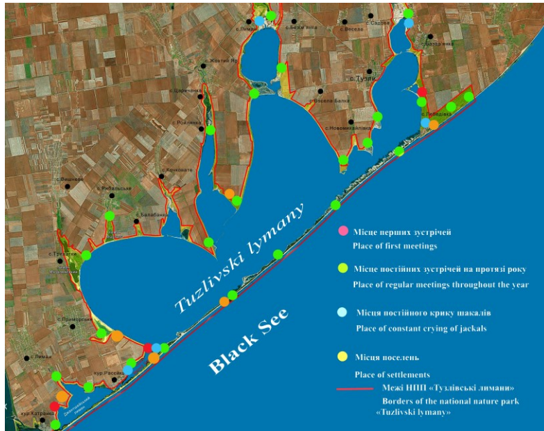
Рис. 2. Реєстрація зустрічей, місця норіння та розміщення виводків шакала звичайного на території НПП «Тузлівські лимани» (2015–2020 рр.).

Fig. 2. Records of sightings, burrowing sites, and broods of the golden jackal in the territory of the Tuzlivski Lymany NNP (2015–2020).