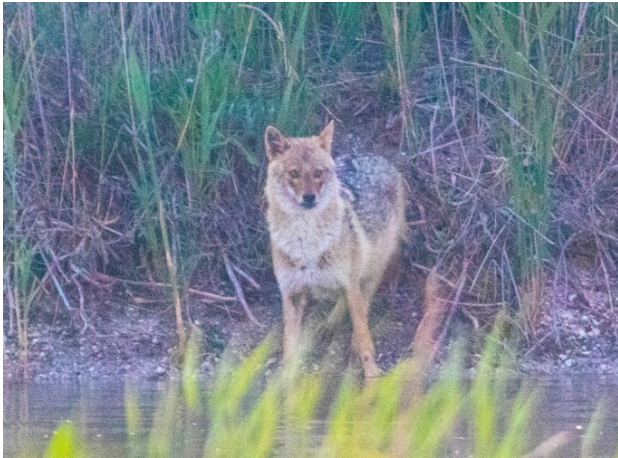
Рис. 6. Шакал на водопої біля протоки між лиманами Шагани та Малий Сасык.

Fig. 5. A pair of jackals occupying about 500 hectares of wetlands near the Shagany estuary (the male jackal marks the limits of its territory with urine followed by the female doing the same).