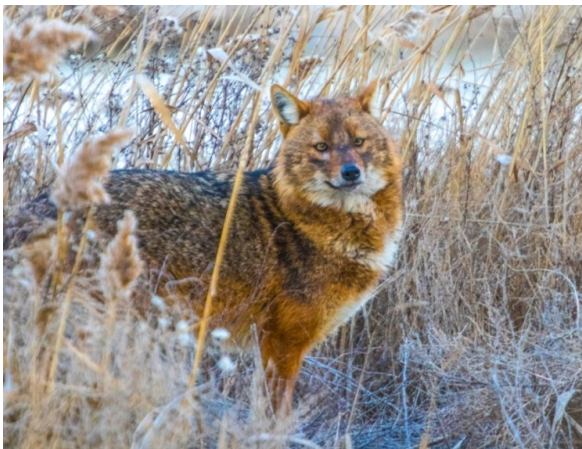
Рис. 4. Вожак шакальної зграї.

За даними С. Стоянова (Stoyanov 2012), чисельність (щільність) шакалів в Болгарії сягає 1–15 (mean 4), в Греції 30, в Румунії (Добруджа) — 0,8 на 1000 га. Виходячи з аналізу зібраних польових даних, можна констатувати, що зараз чисельність шакала на території Парку та його прилеглих територіях, відносно стабільна, але вище ніж в період, коли рівень води в лиманах був вищий, тобто, вище ніж 5 років тому. Протягом п'яти років спостережень з 2015 по 2020 рр. чисельність шакала зростала завдяки розширенню суходолу Тузлівських лиманів, де раніше були мілини і природні та штучні острівні системи, на яких гніздилися водно-болотні птахи. Наприклад, площа акваторій Тузлівських лиманів поступово знижувалася завдяки штучному та протиправному перекриттю природної прорви бракон'єрами (ті, що нелегально виловлюють рибу з лиманів) на 24 км піщаного пересипу, в заповідній зоні (Русев 2017). В результаті цього повністю був заблокований водообмін між Чорним морем та Тузлівськими лиманами і наразі площа висохлих мілководь лиманів сягає приблизно 5000 га.