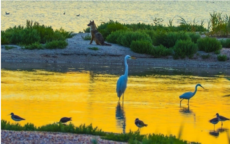
Рис. 9. Шакаліха серед водно-болотних птахів Парку на піщаній косі лиману Шагани.

Fig. 9. A female jackal among wetland bird on a sand spit in the Shagany estuary.