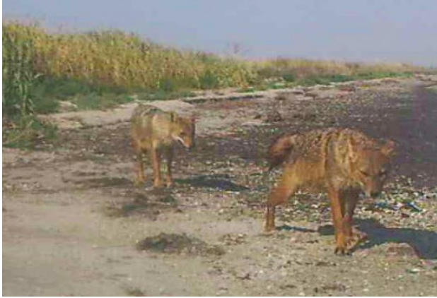
Рис. 5. Пара шакалів, яка займає ділянку біля 500 га водно-болотних угідь біля лиману Шагани (самець шакала визначає межу своїх володінь сечею, слідом за ним мітки робила і самиця).

Fig. 5. A pair of jackals occupying about 500 hectares of wetlands near the Shagany estuary (the male jackal marks the limits of its territory with urine followed by the female doing the same).