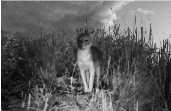
Рис. 10. Цуценя шакала у віці біля 4-х місяці.

Fig. 10. A jackal puppy of about 4 months of age.