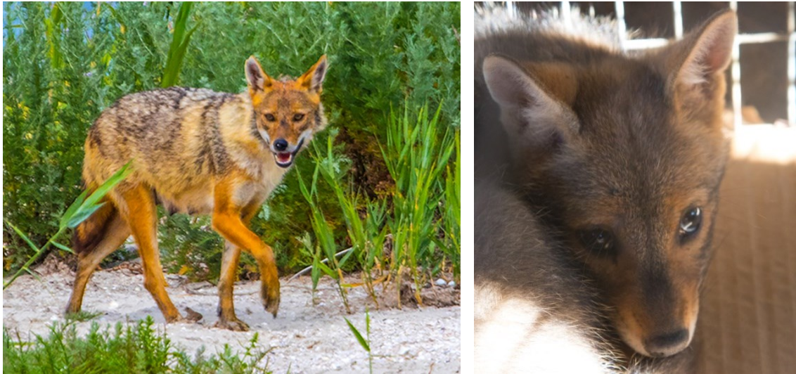
Рис. 11. Шакалиха на полюванні (ліворуч) та цуценя шакала, підібране місцевими мешканцями (праворуч). Fig. 11. A female jackal on hunting (left) and a jackal puppy picked up by locals near the park (right).