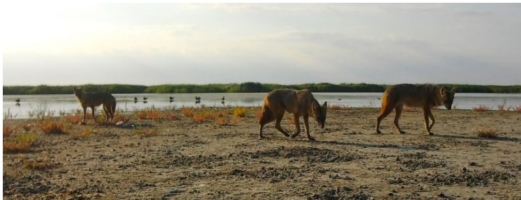
Рис. 8. Молоді шакали на ранковому полюванні на березі лиману Малий Сасик.

Fig. 7. A jackal with a mullet, which he took from a great white heron.