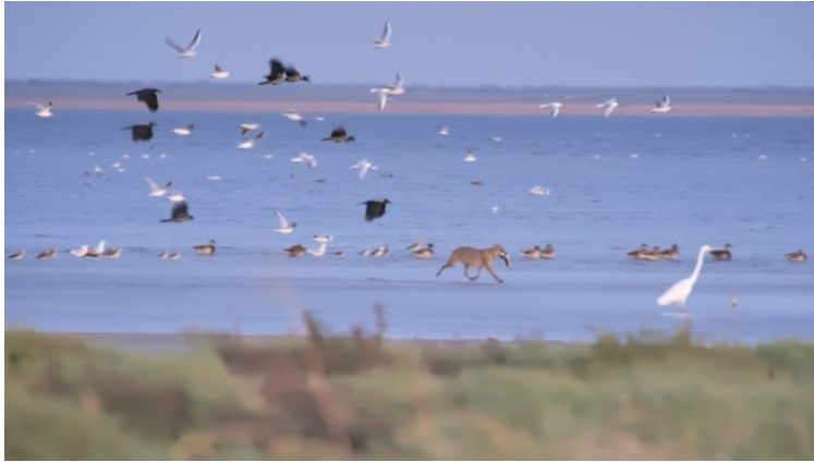
Рис. 7. Шакал з кефаллю-лобаном, яку він забрав від великої білої чаплі.

Fig. 7. A jackal with a mullet, which he took from a great white heron.