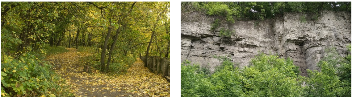
Рис. 9. Біотопи Ділянки 4: a — Міський парк, b — Скелясті стінки Смотрицького каньйону.

Fig. 8. Habitats of Site 3: a , Korchyky Forest near Velykyi Zhvanchyk; b , agricultural lands near Velykyi Zhvanchyk.