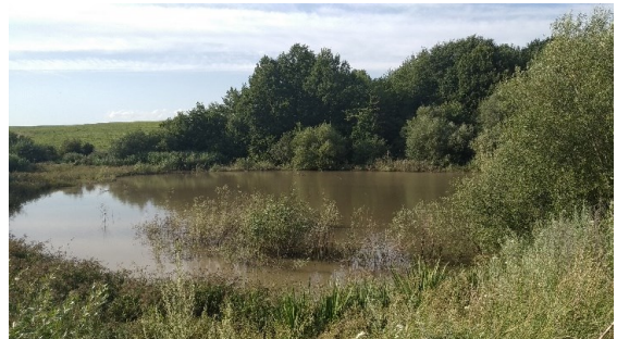
Рис. 5. Біотопи Ділянки 1: a — Товтрове пасмо в окол. с. Слобідка Смотрицька, транзитний шлях кажанів, b — водойма біля лісового масиву в окол. с. Нова Гута, місце годівлі рукокрилих.

Fig. 5. Habitats in Site 1: a , tovtra mounds near Slobidka-Smotrytska, a transit rout of bats; b , a water body near a forest in vicinities of Nova Huta, a foraging site of bats.