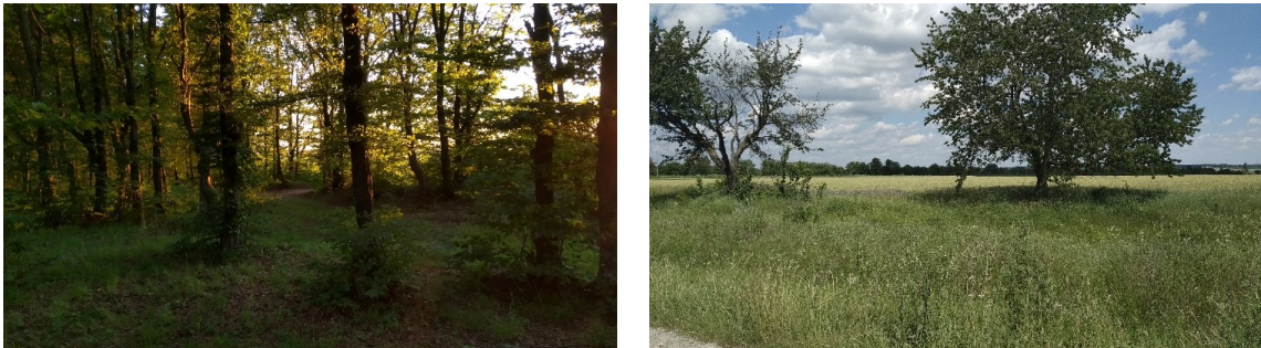
Рис. 8. Біотопи Ділянки 3: a — Ліс «Корчики» в околицях с. Великий Жванчик, b — с/г поля угіддя в околицях с. Великий Жванчик.

Fig. 7. Habitats of Site 3: a , Kruhlyi Pond near Velykyi Zhvanchyk; b , a balka valley and view of the Korchyky Forest near Velykyi Zhvanchyk.