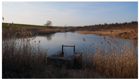
Рис. 6. Біотопи Ділянки 2: a — сільськогосподарські угіддя в околицях с. Баговиця, b — штучні водойми — місце годівлі та водопою кажанів.

Fig. 6. Habitats of Site 2: a , agricultural lands near Bahovytsia; b , artificial water bodies, foraging and watering sites of bats.