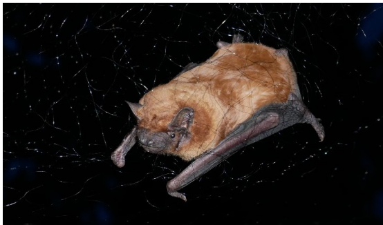
Рис. 4. Масовий проліт дозірних вечірниць: a — візуальне спостереження прольоту кількох тисяч особин Nyctalus noctula , b — Вечірниця дозірня Nyctalus noctula у павутинних тенетах під час відльоту.

Fig. 4. Flying common noctules: a , visual observation of several thousands of common noctules, b , a common noctule Nyctalus noctula captured by mist net.