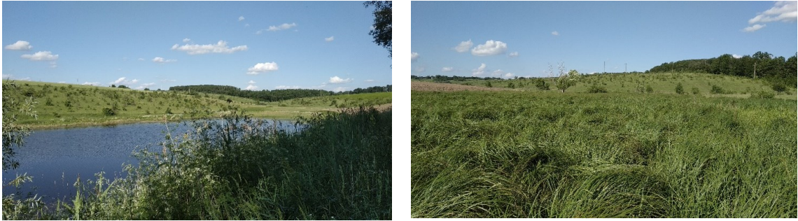
Рис. 7. Біотопи Ділянки 3: a — ставок «Круглий» в околицях с. Великий Жванчик, b — долина балки та вид на ліс «Корчики», околиці с. В. Жванчик.

Ділянка 3. Ділянка знаходиться в околицях с. Великий Жванчик (рис. 7–8). Згідно з проектом організації території Парку (2012), ця ділянка запроєкована як перспективна зона на розширення території Парку. Зазнає істотного антропогенного впливу — тут розташовується несанкціоноване стихійне сміттєзвалище, відбувається інтенсивний випас худоби. У лісовому масиві ведуть збір грибів і хмизу, окремі ділянки використовуються для відпочинку місцевим населенням. У лісовому масиві знаходяться літні оселища рідкісних видів — широкоуха європейського та нічниця в'їхастої. Кілька водойм неподалік використовуються кажанами у якості місця водопою та кормової території. Активність кажанів в межах с/г угідь — низька. На відстані 4 км. від місця дослідження розташовується Яцьковецька копальня — ключове зимове сховище кажанів та місце розмноження підковоноса малого.