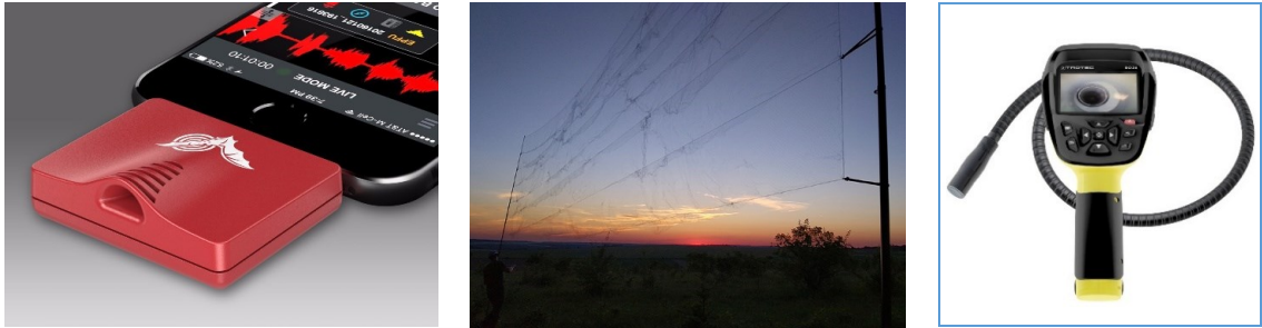
Рис. 1. Ключові засоби обліку: a — детектор Echo Meter Touch Ultrasonic Modules, b — тенета павутинні, c — ендоскоп Trotec BO26.