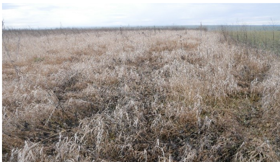
Fig. 5. Habitats in Site 1: a , tovtra mounds near Slobidka-Smotrytska, a transit rout of bats; b , a water body near a forest in vicinities of Nova Huta, a foraging site of bats.