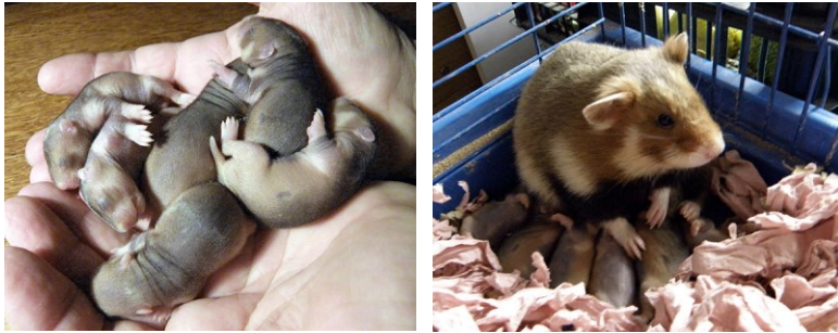
Рис. 4. Хом'яковий приплід: a — дитинчата у віці 5-ти днів від народження; б — дитинчатам пішов 9-й день. Самка, навіть яка виросла в природі, так звикає до людей, що дозволяє брати малюків в руки, а часто намагалася тягти у гніздо й руку, від якої йшов запах малюків.

Fig. 4. Hamster's offspring: a —litter at the age of 5 days; b —litter on the 9th day from birth. The female, which previously lived in the nature, is so accustomed to people that it allows taking the young in hands, and often tried to pull the hand that smelled as the young into the nest.