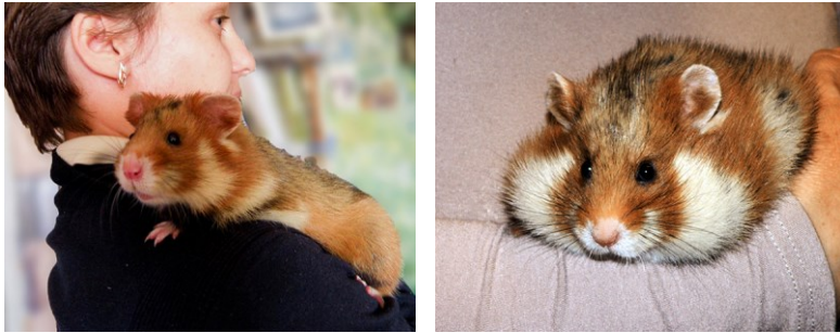
Рис. 3. Хом'яки як зразки доброзичливості: a — хом'яки можуть бути домашніми улюбленцями і не кусаються; b — хом'яки спокійно і навіть з задоволенням сидять на руках людини, цілком довіряючись людині, яка за ними доглядає.

Fig. 3. Hamsters as examples of friendliness: a —hamsters can be pets and do not bite; b —hamsters sit quietly and even happily in human hands, fully trusting the person who cares for them.