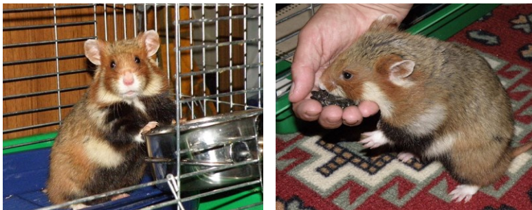
Рис. 2. Хом'яки в процесі споживання їжі: a — хом'як біля годівнички в клітці; b — хом'як під час прогулянки пригощається насінням соняшника.

Дані про склад кормів і харчових добавок (смаколиків), якими ми годували хом'яків упродовж всього часу їх утримання в неволі (2010–2013), узагальнено в таблиці 1.