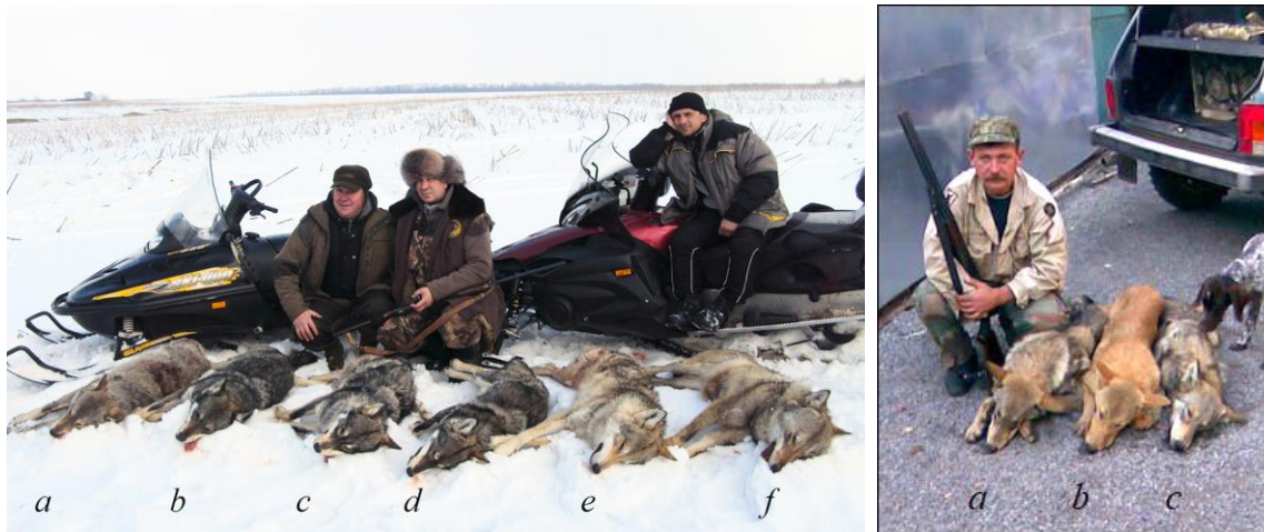
Рис. 2 (ліворуч). Мисливці зі добутими у Дніпропетровській обл. хижакками: (a, e, f) вовки; (b–d) гібриди вовка та пса.

Однак після зменшення розміру матеріальної винагороди за видобуток зазначеного хижака наприкінці 70-х років мисливський тиск на його популяції значно скоротився. Враховуючи, що між чисельністю вовка та розміром його видобутку існує чітка позитивна кореляція (рис. 4), у результаті цього, популяції вовка стали стрімко зростати. Наприклад, у Республіці Білорусь це було зареєстровано після зниження вилучення хижаків до 25–30 % на рік [Vadkovsky 1978]. У 1971–1980 роках відбулося відновлення осередків вовка в Українському Поліссі та збільшення його чисельності в Карпатах. Дуже швидко зазначений процес набув значних масштабів і появу цього хижака стали відзначати у різних місцях Румунії, Польщі, Словаччини та інших країн [Bibikov 1974].