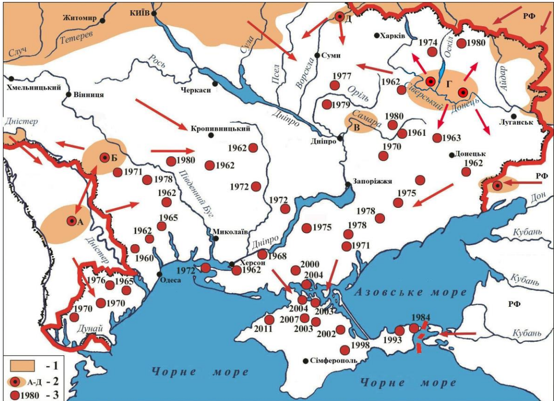
Рис. 5. Експансія вовка на територію Південної України [Volokh 2011, зі змінами]: (1) ареал у 1970-х роках; (2) місця постійного проживання; (3) місця та час першої реєстрації у 1962–2009 рр.

Fig. 5. Expansion of the wolf to the territory of southern Ukraine [Volokh 2011, with changes]: (1) sites of the species distribution in the early 1970s; (2) places of permanent residence; (3) places and times of first registration in 1962–2009.