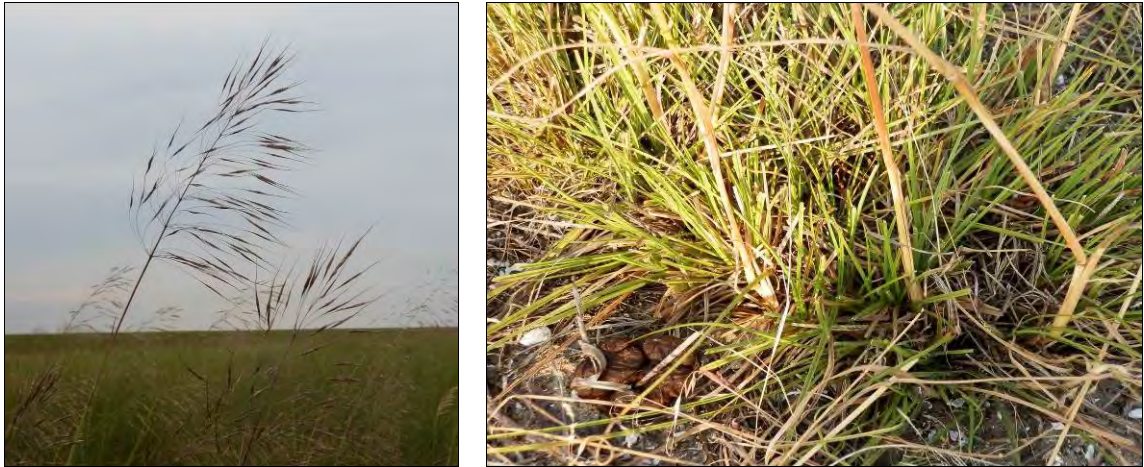
Рис. 4. Chrysopogon gryllus (L.): (a) окремі рослини, (b) погризи копитними у весняно-літній період.