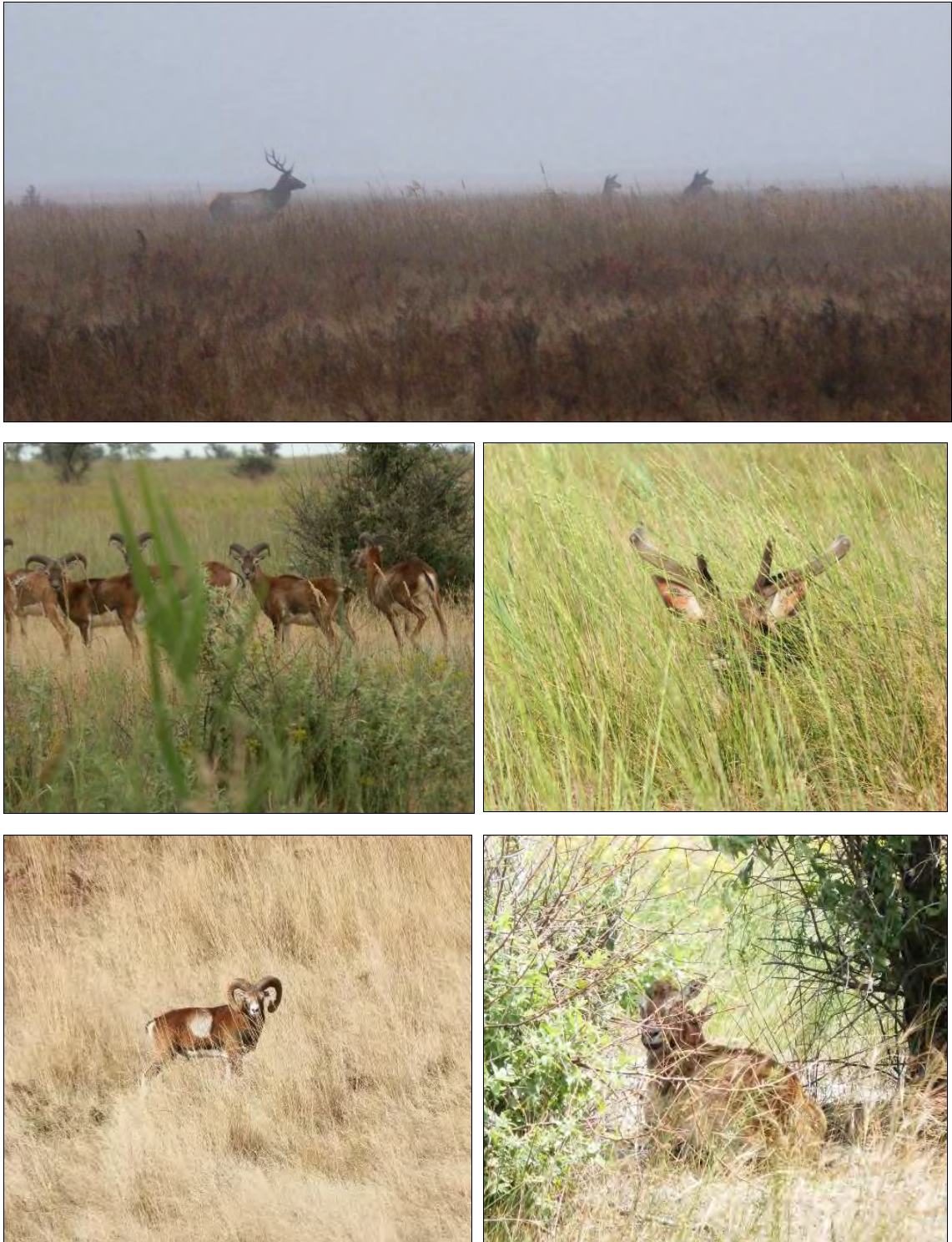
Рис. 2. Типові види ссавців у складі мисливської фауни острова Джалиргача: (а) обліки на реву, «ранок у гаремі», (b) Зустріч групи молодих самців муфлона на маршруті, (c) олені особливо обережні у період росту пантів; (d) баран у час «шлюбних перегонів», (e) самка муфлона з малям; червень 2014 року.