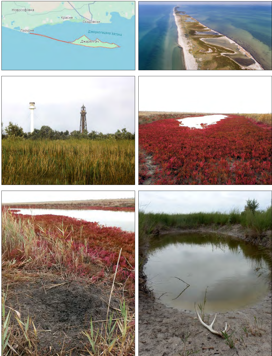
Рис. 1. Острів Джарилгач та його біотопи: (а) схема острова; (b) коса, (c) рослинність на захід від маяків восени; (d) солончак з солонцями ( Salicornia ); (e) гінна ямка оленів у заболоченій місцевості; (f) штучна водойма як привабливе місце для копитних.

Fig. 1. Dzharylgach Island and its habitats: (a) map of the island; (b) spit, (c) vegetation west of the lighthouses in autumn, (d) salt marsh with Salicornia ; (e) deer rutting pit in a marshy area, and (f) artificial pond as an attractive place for ungulates.