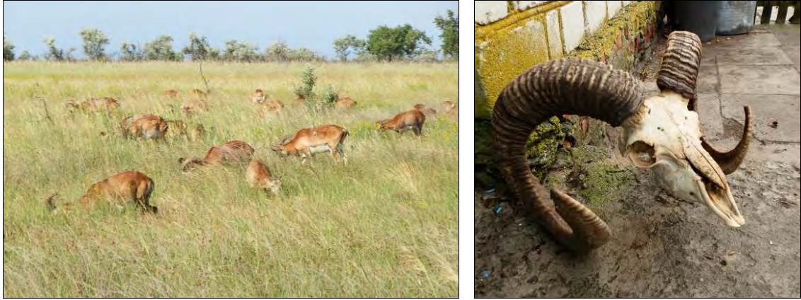
Рис. 5. Муфлони о. Джарилгач: (а) стадо на випасі, (б) пошкодження кінчиків рогів у дорослих особин. Fig. 5. Mouflon on Dzharylgach Island: (a) a grazing herd, (b) damage to horn tips in adults.

Розрахунки оптимальної чисельності диких тварин, згідно з «Проектом організації та розвитку Скадовського досвідного лісомисливського господарства», встановили орієнтовні межі допуску: стан кормової бази «дозволяє» проживати на острові 151 оленю, 104 ланям та 130 муфлонам (див. табл. 2). Таке рівне співвідношення чисельності видів може бути пояснено формуванням стабільної гільдії, до складу якої вони входять. Аналіз гільдії великих фітофагів є у відповідних статтях щодо фауни України: [Vyshnevsky 2002; Zagoodniuk 2007]. Як слідує з описів видів [Korneev 1965], розмірне співвідношення суміжних видів наявної гільдії складає: сарна — 100–130 см, лань — 130–140, свиня — 150–180, олень — 200–250 см, що цілком відповідає очікуваним значенням за сталою Хатчінсона ( HR = 1,27 ).