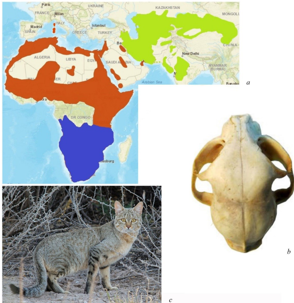
Рис. 1. Кіт степовий ( Felis silvestris lybica): (a) ареал поширення, (b) череп F. s. lybica ; (c) загальний вигляд тварини.