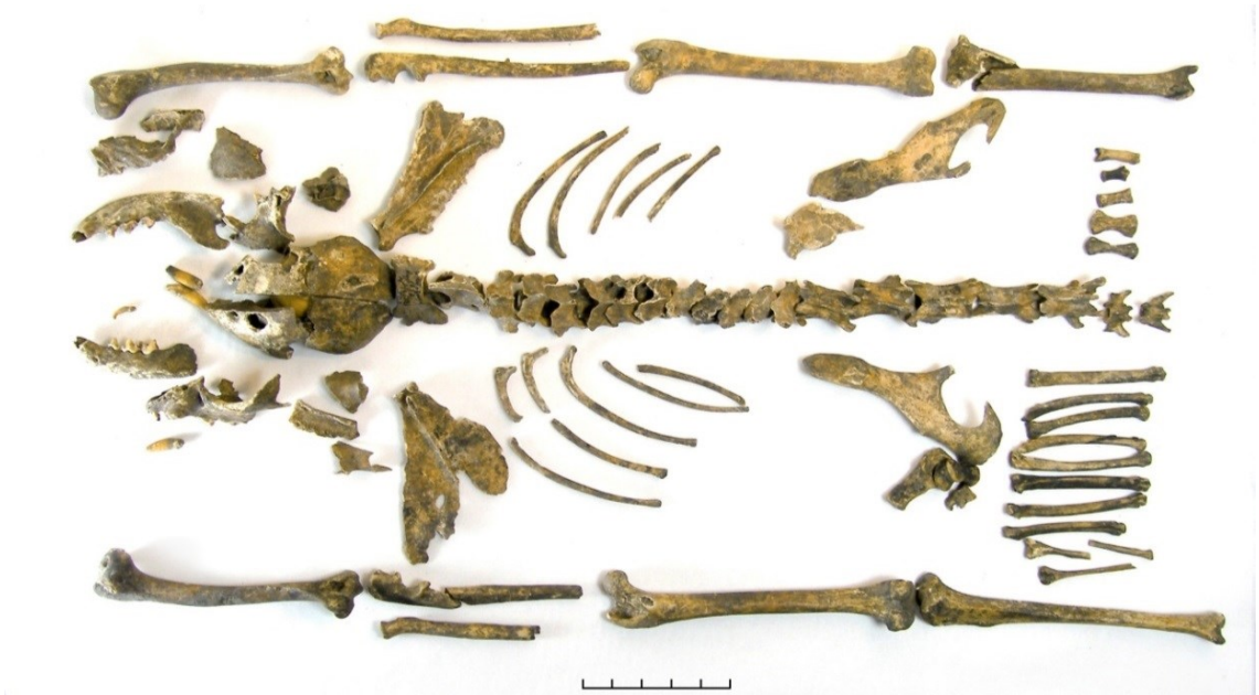
Рис. 3. Кіт з поховання Х ст. на могильнику Шестовиця.

Серед інших добре відома знахідка 1938 р. на садибі Михайлівського Золотоверхого монастиря. Розкопками Галі Корзухіної та Михайла Каргера виявлена «землянка художника», що, очевидно, загинула в пожежі під час монгольського погрому Києва взимку 1240 р.