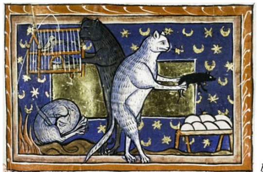
Рис. 5. Коти на мініатюрах середньовічних манускриптів: (а) Абердинський бестиарій, бл. 1200 р. Англія (Aberdeen University Library, MS 24, fol. 23v; www.abdn.ac.uk ); (b) Бестиарій, XIII ст., Англія (Bodleian Library, MS. Bodl. 764, fol. 51r; https://digital.bodleian.ox.ac.uk ).