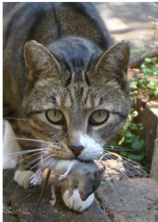
Рис. 4. Гризуни в середньовічній Європі і коти як мисливці на гризунів: (а) пацюки, що їдять тіла померлих на вулицях міста. Біблія Мацейовського, 1240–1250 рр. (NY, Morgan Library & Museum, MS M.638, fol. 21v; www.themorgan.org); (b) сучасний кіт свійський з упольованою мишею.