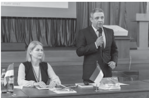
Зліва направо: Валентина Кирилюк та Євген Бараш

Відкрив захід начальник Інституту кримінально-виконавчої служби, доктор юридичних наук, заслужений діяч науки і техніки України, генерал-майор внутрішньої служби Євген Бараш , який наголосив на тому, що під егідою Інституту кримінально-виконавчої служби вдалося зібрати досвідчених і знаних учених,