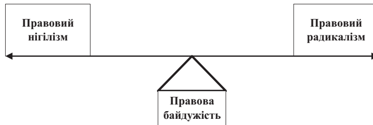
Рис. 2. Відображення балансування правового нігілізму та правового радикалізму в системі правової байдужості

За цим же часовим простором правовий радикалізм із своєю екстремальністю (тобто захоплення ідеями, що виходять за межі традиційного правового порядку; використання насильства або загроз ним для досягнення правових цілей; заклик до однієї єдиної ідеології та відмова від визнання різноманітності точок зору) у мирний час концентрує увагу на застосуванні радикальних правових засобів для політичного впливу чи контролю, а у воєнний період – на використанні екстремальних заходів для захисту національних інтересів.