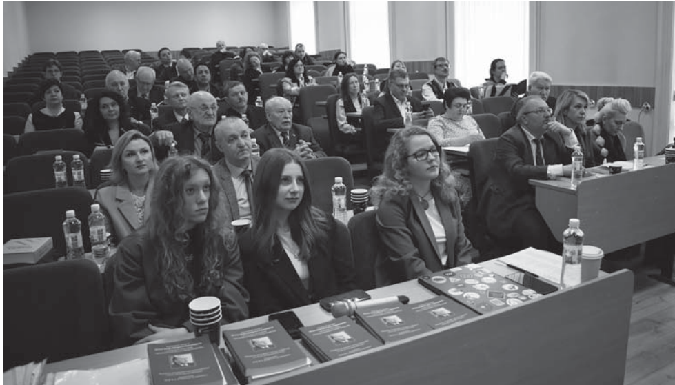
Учасники пленарного засідання конференції (юридичний факультет Львівського національного університету імені Івана Франка, 28 березня 2025 р.)

роботі “Теорія істини в радянському праві” (1959). С. Рабінович наголосив на низці наскрізних методологічних засад наукової творчості проф. П. Рабіновича і тих ідей, які видатний теорійник сповідував протягом свого творчого життя: принципах об’єктивізму і соціально-сутнісної спрямованості правового пізнання.