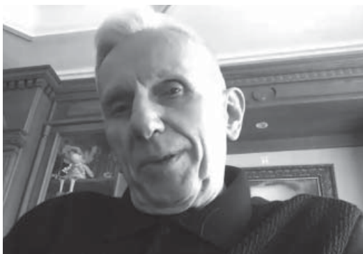
Звернення головного редактора журналу “Право України” академіка ОЛЕКСАНДРА СВЯТОЦЬКОГО з вітальним словом до учасників конференції (онлайн)

Метою проведення цього наукового форуму стало вшанування пам'яті заслуженого професора ЛНУ імені Івана Франка, академіка НАПрН України професора П. Рабіновича (1936–2023), дослідження наукового доробку видатного українського вченого та різноаспектний аналіз його внеску в