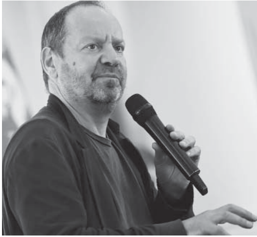
Виступ учасника конференції Філіпа Сендса – професора права, директора Центру міжнародних судів і трибуналів Університетського коледжу Лондона, 29 березня 2025 р. (онлайн)