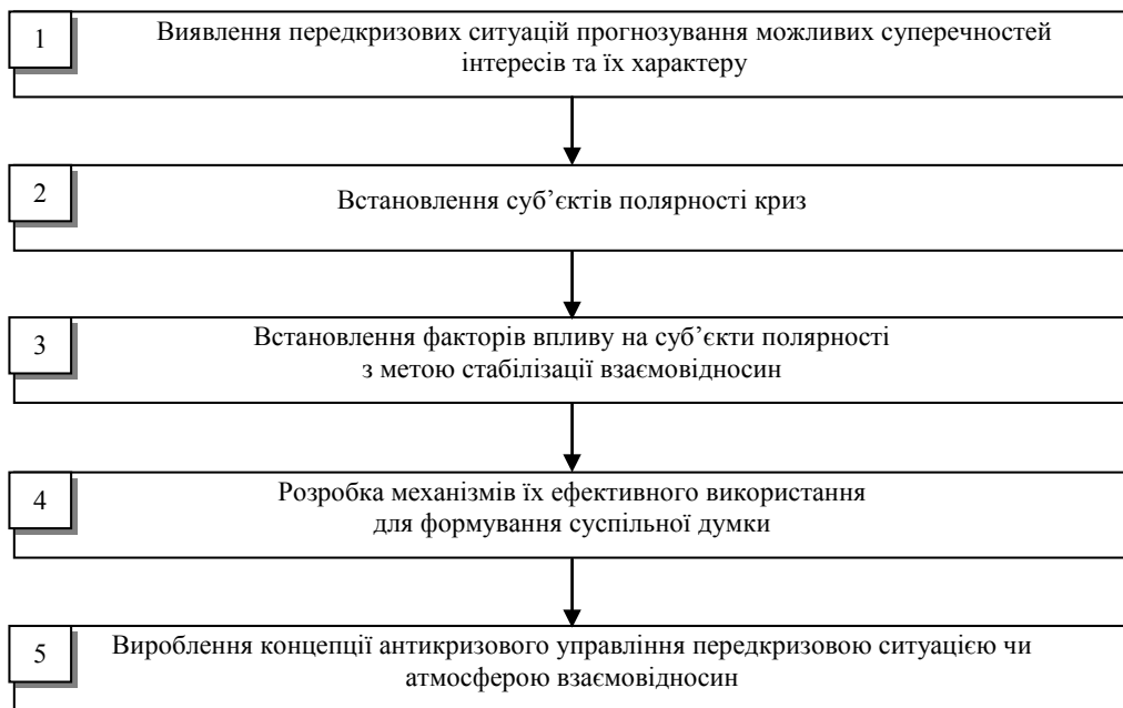
Рис. 3. Етапність управління кризами взаємовідносин

загальносуспільних. Підтвердженням сказаного є розрив і руйнування відносин, які формувались впродовж 70 років у колишньому СРСР. Без сумніву, криза взаємовідносин породжує всі інші кризові явища, і якщо ці постулати не вивчати та не враховувати у загальній теорії криз, то попереджувати кризові ситуації, запобігати їх наслідкам у економічному, політичному та суспільному житті держави буде значно складніше.