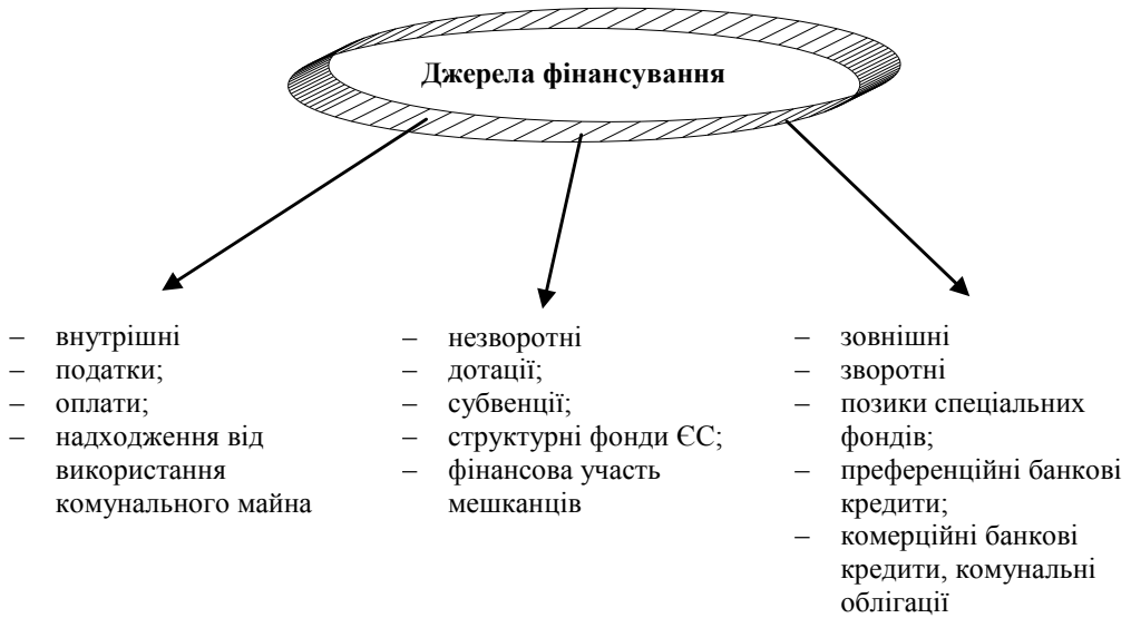
Рис. 2. Джерела фінансування інвестицій самоврядування гміни (Власне опрацювання).

Новими формами фінансування одиниць територіального самоврядування є публічно-приватні заходи, лізинг, факторинг.