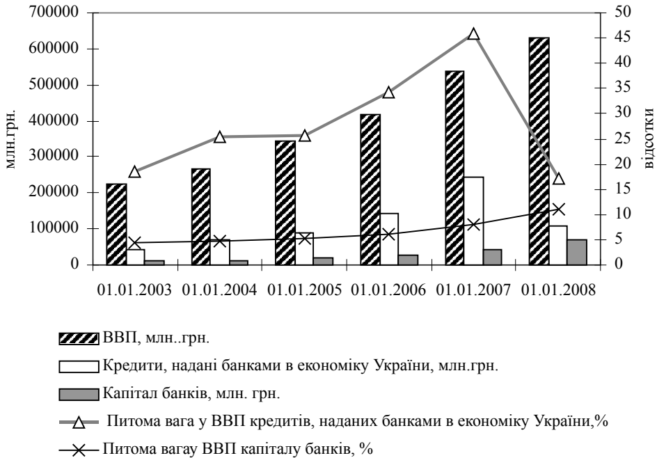
Рис. 2. Співвідношення власного банківського капіталу і наданих кредитів до ВВП за період 2003–2008 рр. (Складено на основі опрацювання [3])

повинно стабільно зростати. Сьогодні в Україні частка банківського капіталу у ВВП становить лише 11,04 %, у 2006 р. – 7,94%. І це при незначних обсягах ВВП на душу населення (у 2006 р. цей показник в Україні становив 2278 дол., тоді як у Росії – 6932 дол., Литві – 8770, Латвії – 8796, Польщі – 8888, Естонії – 12237, у країнах Євросоюзу – 33493 дол.) [6].