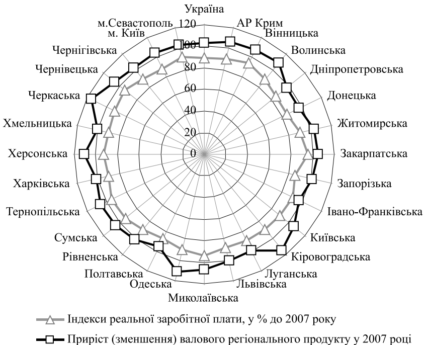
Рис. 2. Порівняння зміни реальної заробітної плати та валового регіонального продукту за регіонами України у 2008 р.

З наведеного (рис. 2) бачимо, що реальна заробітна плата за 2008 рік в усіх регіонах України зменшилася (лінія індексу реальної заробітної плати розташована всередині кола, що показує 100%). Найсуттєвіше падіння спостерігалось у Донецькій та Дніпропетровській областях, відповідно – до 84% та 85,1%. Найменші показники спаду рівня реальної заробітної плати – у Закарпатській, Чернівецькій та Тернопільській областях, відповідно – до 95%, 94,3% та 94,1% при зростанні валового регіонального продукту на 4-6%. Разом з тим, у Черкаській, Кіровоградській,