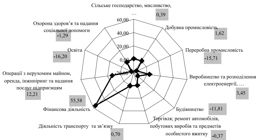
Рис. 3. Індекси ефективності структурних трансформацій у залученні іноземних інвестицій в Україну за видами економічної діяльності

PII_i, PII_1 – питома вага прямих іноземних інвестицій в i -тий вид економічної діяльності в загальному обсязі прямих іноземних інвестицій в економіці відповідно в 2005 та 2009 рр.