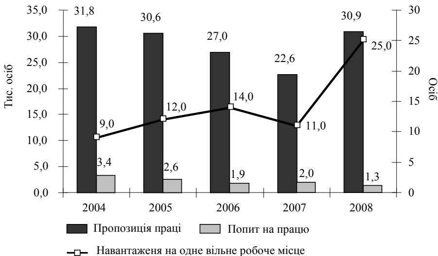
Рис. 2. Динаміка попиту, пропозиції та навантаження на ринку праці Сумської області

Наявність структурної диспропорції між попитом на робочу силу та її пропозицією за професіями є чинником, що обмежує можливості працевлаштування безробітних та задоволення потреб роботодавців у працівниках. Надзвичайно загострилося стала ситуація з професіями та спеціальностями, що не потребують високого рівня професійної підготовки та кваліфікації працівників. Наприкінці 2008 р. серед кваліфікованих працівників сільського та лісового господарства, риборозведення та рибальства на одне вільне робоче місце претендували 74 осіб, серед працівників з обслуговування, експлуатації та контролювання за роботою технологічного устаткування, складання устаткування та машин – 42 особи, серед працівників сфери торгівлі та послуг – 40 осіб, серед технічних службовців – 39 осіб.