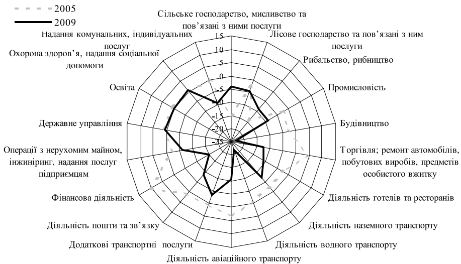
Рис. 1. Різниця між рівнями прийому та вибуття працівників в Україні у 2005 р. і 2009 р. за окремими видами економічної діяльності, % до середньооблікової кількості штатних працівників

У докризовий період праця українців була більш затребуваною національною економікою: перевищенням рівня прийому над рівнем вибуття працівників у 2006 і 2008 рр. характеризувалися шість секторів економіки, у 2005 і 2007 рр. – вісім. Це також підтвердили результати досліджень міжнародних організацій. За висновками фахівців Світового банку, які проводили дослідження попиту на українському ринку праці у 2000–2007 рр. [6], упродовж періоду економічного зростання в країні збільшився попит на професійні уміння і навички в усіх сферах діяльності, ситуація відповідала картині високої професійної мобільності, а українські працівники дедалі частіше переходили з одного робочого місця на інше за власної ініціативи. Порівняльний аналіз динаміки обороту робочої сили у 2009 і 2008 рр. за причинами звільнення дозволяє простежити чітку тенденцію