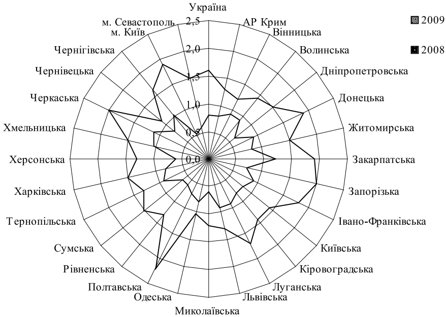
Рис. 3. Рівень вибуття працівників з причин скорочення штатів у 2008–2009 рр. за регіонами України, % до середньооблікової кількості штатних працівників

Серед причин, які так чи інакше сприяли формуванню вказаних тенденцій, вагомим чинником стало внесення змін до законодавчих актів, що регулюють відносини зайнятості. Насамперед, це прийняті в грудні 2008 р. за ініціативи та безпосередньої участі Державної служби зайнятості України зміни до Закону України «Про зайнятість населення», Постанови Кабінету Міністрів України «Про затвердження Порядку реєстрації, перереєстрації та ведення обліку громадян, які шукають роботу, і безробітних». Як антикризові заходи прийняті положення передбачали зміну критеріїв підходящої роботи, а також зміну підходів до оцінки зайнятості мешканців сільської місцевості у бік застосування більш жорстких вимог щодо надання статусу безробітного.