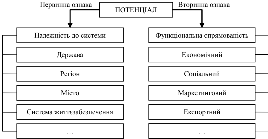
Рис. 4. Класифікація потенціалу СЕС

Згідно з правилами формальної логіки, а саме визначення роду та виду поняття, дефініція потенціалу формулюється наступним чином. Потенціал в економіці являє собою сукупність взаємопов'язаних ресурсних, організаційних та управлінських можливостей СЕС, використання яких дозволяє їм здійснювати свої функції.