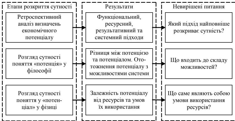
Рис. 1. Результати етапів розкриття сутності поняття «потенціал»