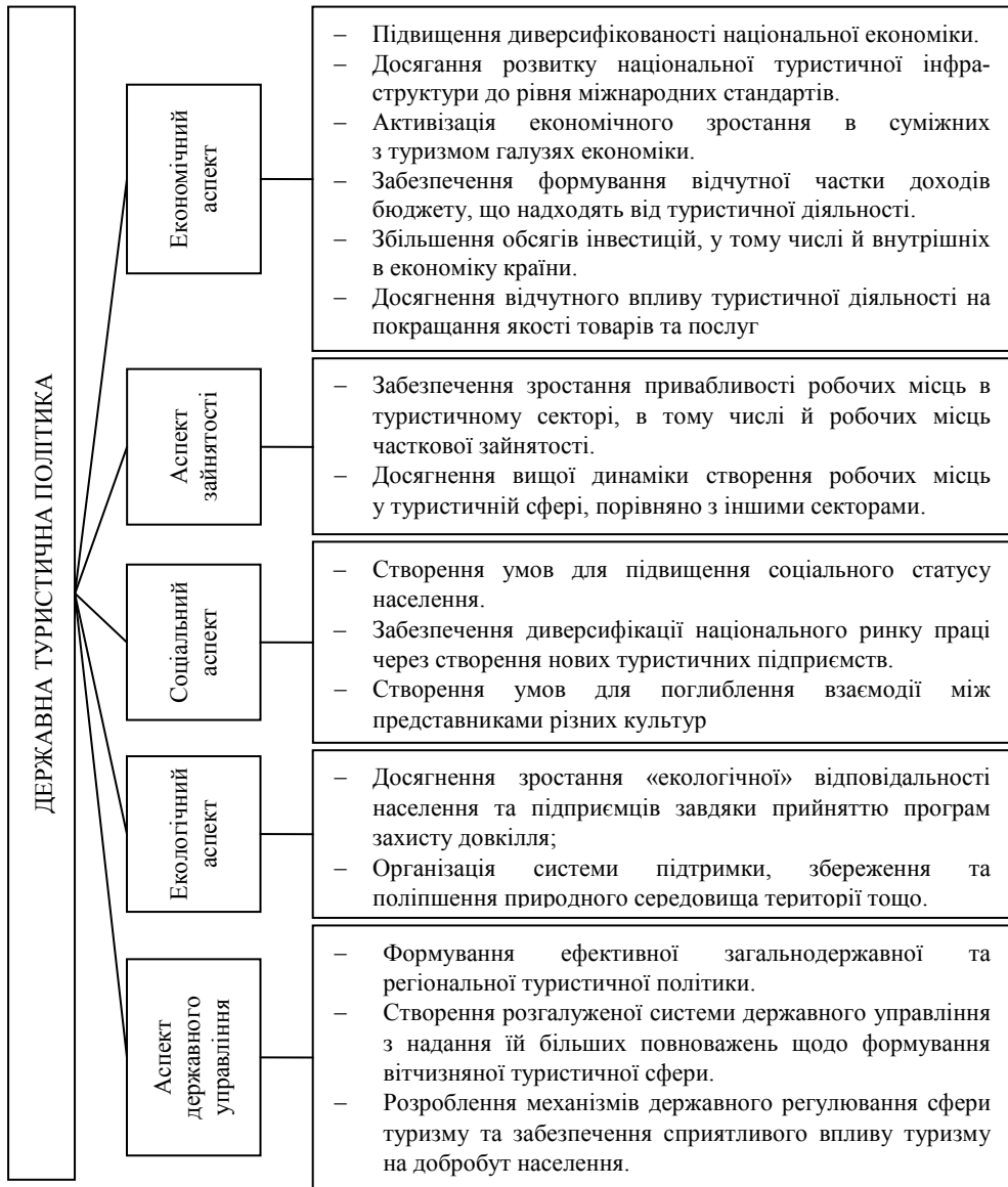
Рис. 1. Основні вимоги до державної туристичної політики.