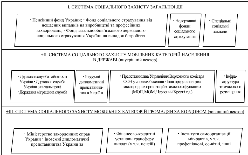
Рис. 3. Інституційна модель системи соціального захисту мобільних категорій населення України Авторська розробка.