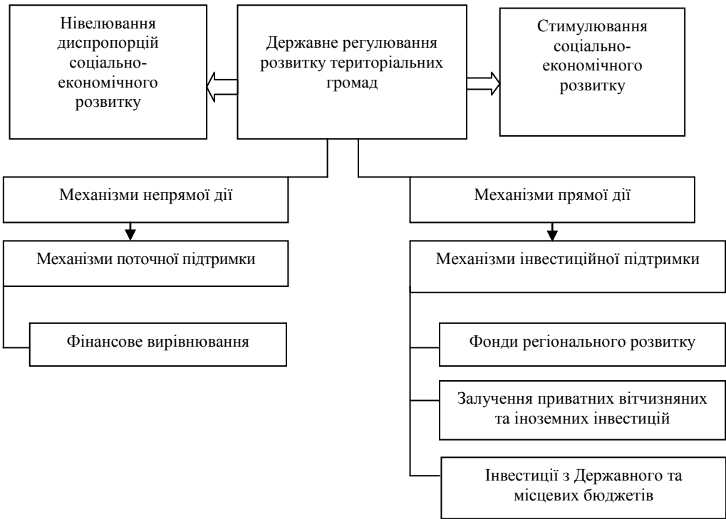
Рис. 3. Напрями державного регулювання розвитку територіальних громад

В умовах проведення адміністративно-територіальної реформи та реформи децентралізації висуваються якісно нові вимоги до дослідження територіальних громад з позицій не лише соціальної спільноти та суб'єкта місцевого самоврядування, але і регулятора розвитку своєї території, що вимагає поглибленого дослідження економічного, фінансового, майнового боку відносин. Створені в Україні об'єднані територіальні громади законодавчо наділені правами, що дозволяють їм, з одного боку, підвищити фінансову спроможність, а з іншого – відповідальність за розвиток своїх територій. Територіальні громади одночасно є суб'єктом регулювання розвитку власної території та об'єктом регулювання (як адміністративно-територіальна одиниця базового рівня) в системі управління владних структур вищого рівня (регіонального, державного).