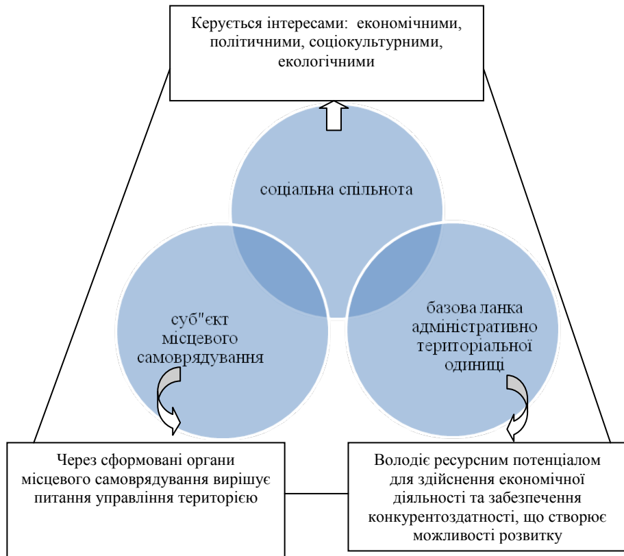
Рис. 2. Ідентифікація територіальної громади на основі теоретичних підходів

політичними, соціокультурними й екологічними інтересами; як суб'єкт місцевого самоврядування здатна управляти в умовах взаємодії з зовнішнім середовищем і нести відповідальність за збереження цілісних орієнтирів; як базова ланка адміністративно-територіального устрою , що характеризується системністю, володіє певним ресурсним потенціалом, що забезпечує їй конкурентні переваги та створює можливості для розвитку території.