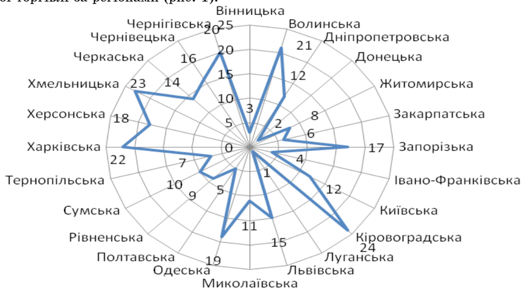
Рис. 1. Індекс фізичного обсягу роздрібної торгівлі (у порівняних цінах) за регіонами у 2018-2019 рр. Джерело: побудовано автором.

Можна простежити також загальну тенденцію до зростання обороту роздрібної торгівлі за регіонами (рис. 1).