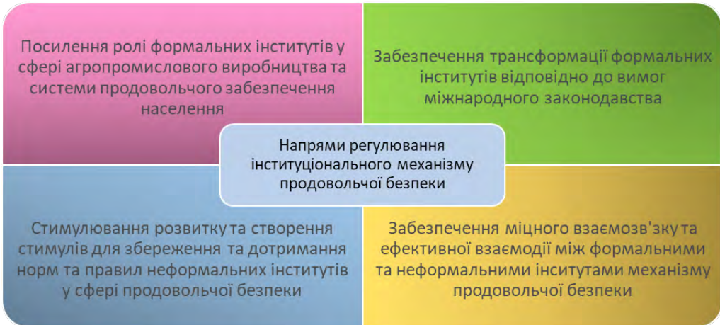
Рис. 2. Напрями регулювання інституціонального механізму продовольчої безпеки

міцного взаємозв'язку та ефективної взаємодії між формальними та неформальними інститутами механізму продовольчої безпеки (рис. 2).