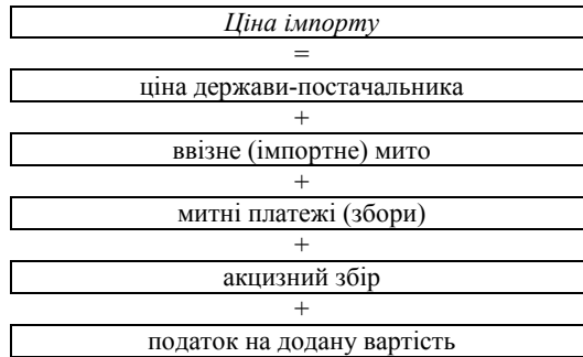
Рис. 3. Основні складові елементи імпорتنної ціни