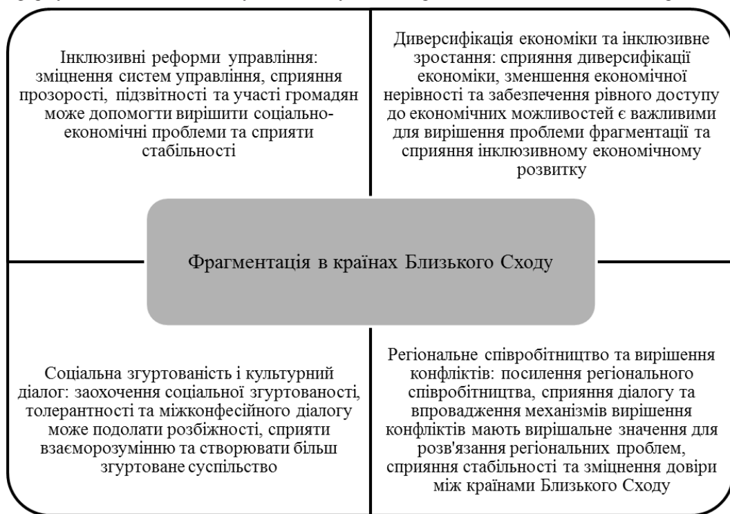
Рис. 2. Стратегії вирішення проблеми фрагментації у країнах Близького Сходу

Іншим фактором, вплив якого на розвиток підприємництва не є рівномірним, – це загальний запас грошей, що обертаються в економіці. Це негативно впливає на рівень самозайнятості та позитивно позначається на нових підприємствах. Це явище знайоме для економік з високою інфляцією та низькими процентними ставками. Щоб оцінити стан підприємництва та розробити правильну політику, країнам Близького Сходу належить сформулювати більш комплексну екосистему для підприємницької діяльності та запровадити