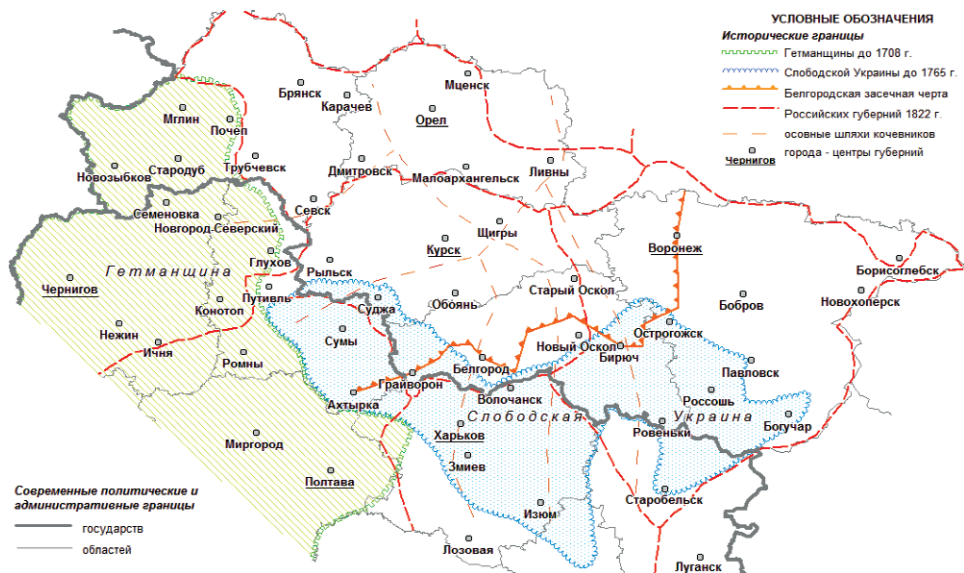
Рис. 1. Историко-географические границы российско-украинского приграничья

рение и торговлю 2 . Однако Гетманщина и Слободская Украина имели разный политический статус в пределах России. Гетманщина была под протекторатом России, сохраняя свое автономное положение до времени правления Екатерины II, в то время как Слободская Украина была частью России. Казачество Слободской Украины не было вольным как, например, казачество Дона, и возглавлялось назначаемым из Москвы белгородским воеводой.