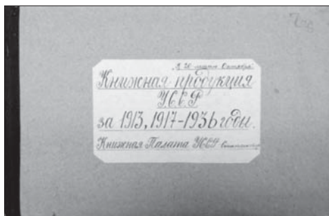
Фото 2. Звітний збірник про випуск книжкової продукції

Ретельний аналіз цього документа дає підстави стверджувати, що деталізацію статистичного обліку за різними критеріями (окрім кількості назв і накладів) розпочато в 1922 р. Припускаємо, що початок такої роботи пов'язаний з остаточним формуванням Української книжкової палати як самостійної державної установи згідно з постановою Ради Народних