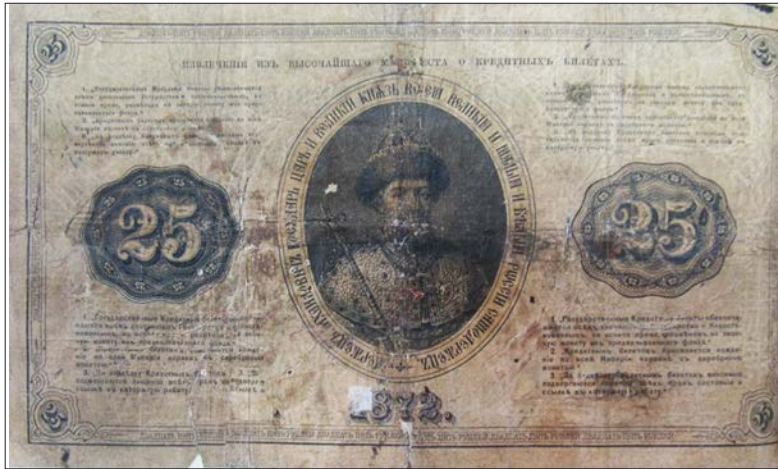
Ил. 3. Фальшиві 25 руб. зразка 1872 р., виявлені Летичівським казначейством та погашені штампами з підписом у лівому верхньому куті: «2217-й, старшим слідчим Летичівського повіту Кам'янець-Подільського округ.».

Отже, у XIX та на поч. XX ст. головну функцію з проведення експертизи паперових грошових знаків виконувала саме ЕЗДП, на адресу якої поштою надсилалися підозрілі грошові знаки, після чого до департаменту поліції надходив лист (Іл. 4) з актом експертизи (Іл. 5) та повідомленням, що підроблені грошові знаки знищено [45, арк. 209–210]. Хоча відомі й винятки: дослідник В. Карпукін виявив у фондах Державного архіву Тюменської області приписи щодо відправлення виявлених фальшивих кредитних білетів до Асигнаційного Банку [46, с. 172]. Фахова експертиза грошових знаків є однією з найважливіших ланок у системі протидії держави фальшивомонетництву [47].