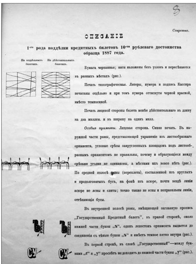
Іл. 2. Інформаційний бюлетень випробувальної станції Головного управління пошти та телеграфів про ознаки підробок кредитних паперів та поштових марок із графічною деталізацією елементів захисту та відмінних рис. Київ. 1907 р

Слід також звернути увагу на характерну лексику експертів для описування ознак та відмінностей фальшивих кредитних білетів: «ніжніший» [35, str. 310–353], «неясний» [36, str. 5] та «дурний», визначених ЕЗДП [37, арк. 30]. Задля досягнення кращого захисту використовувалися різні шрифти, на які зверталася