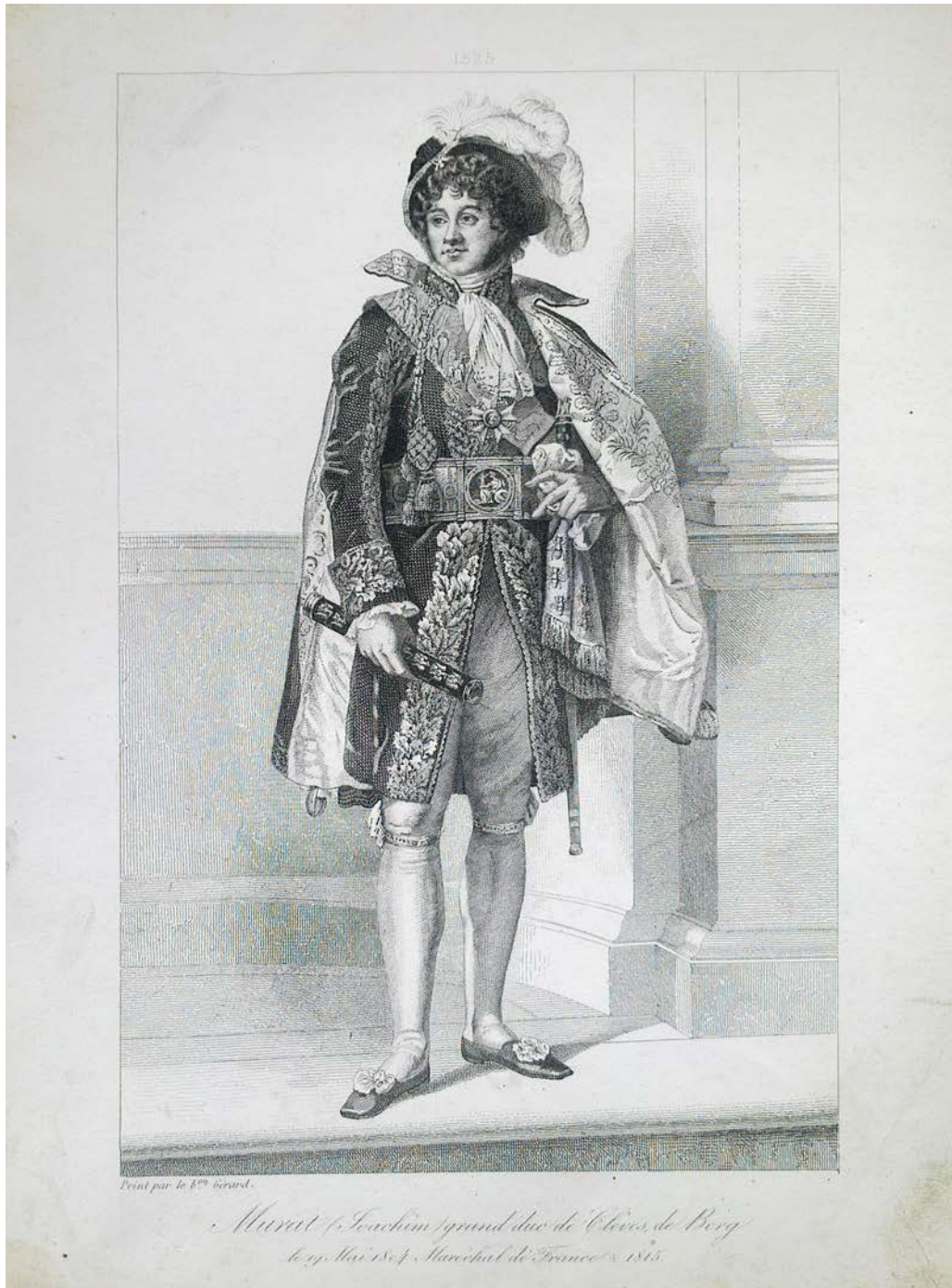
Іл. 4. Йоахим Мюрат (фр. Joachim Murat ; 1767–1815).