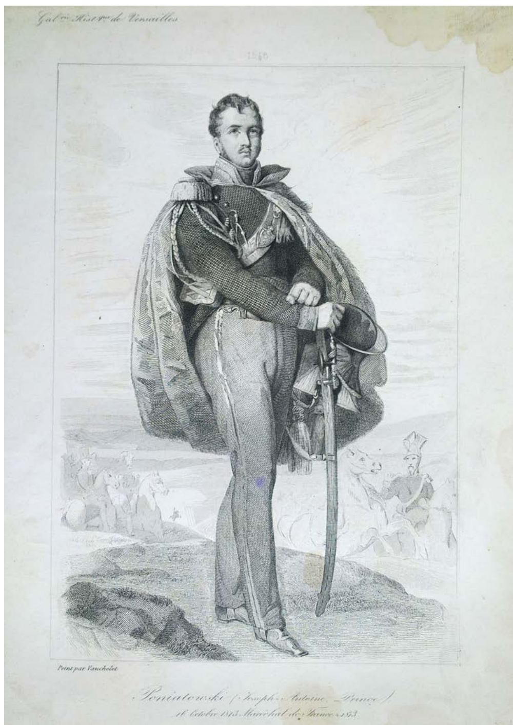
Л. 8. Юзеф Антоній Понятовський (пол. Poniatowski, Józef Antoni ; 1763–1813).