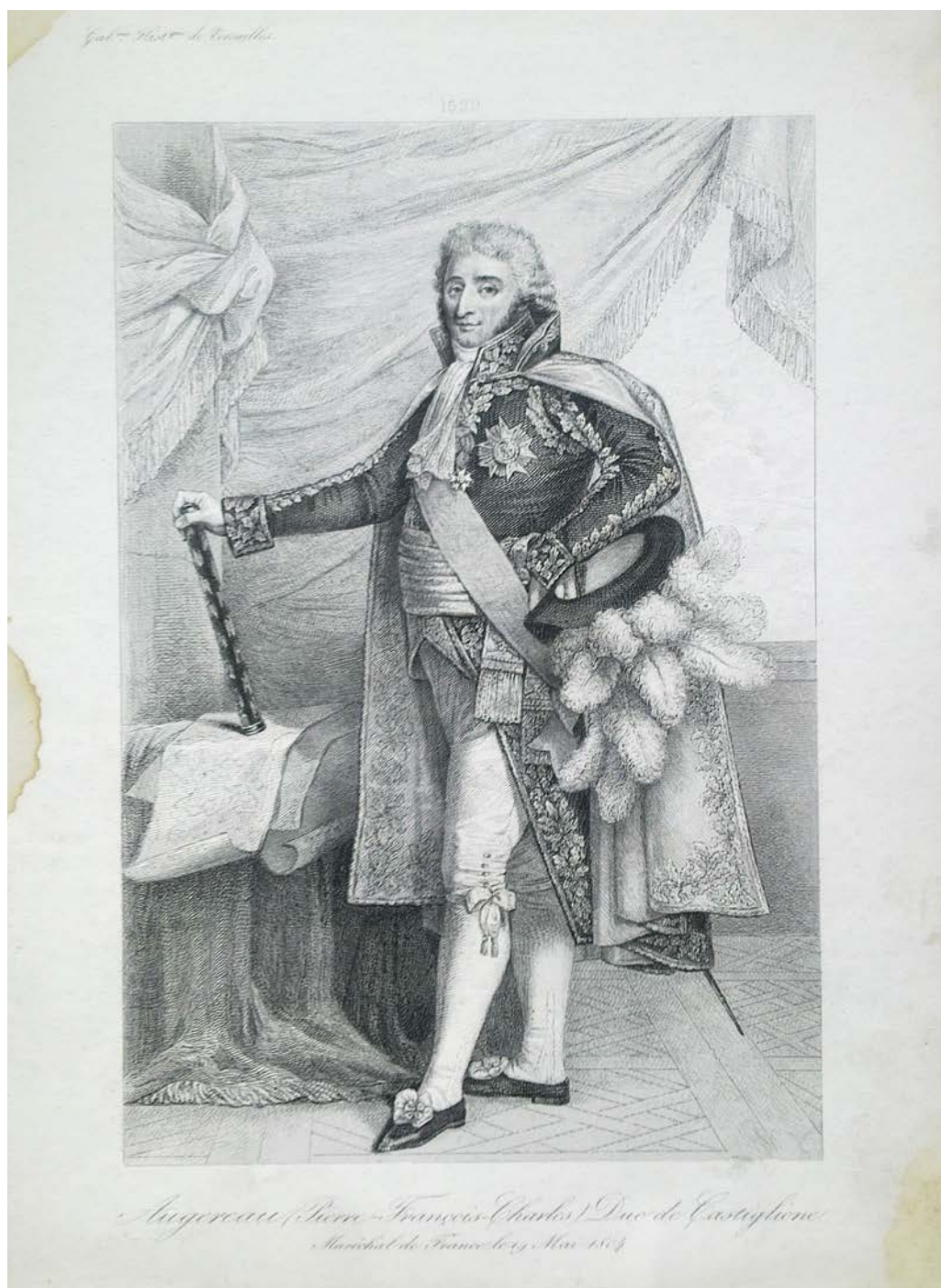
Ил. 3. П'єр-Франсуа-Шарль Ожеро (фр. Pierre-François-Charles Augereau ; 1757–1816).