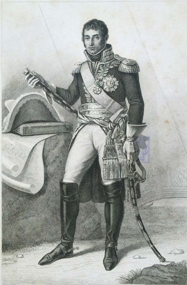
Masséna (André), Duc de Rivoli Général, Maréchal de France, 1807.