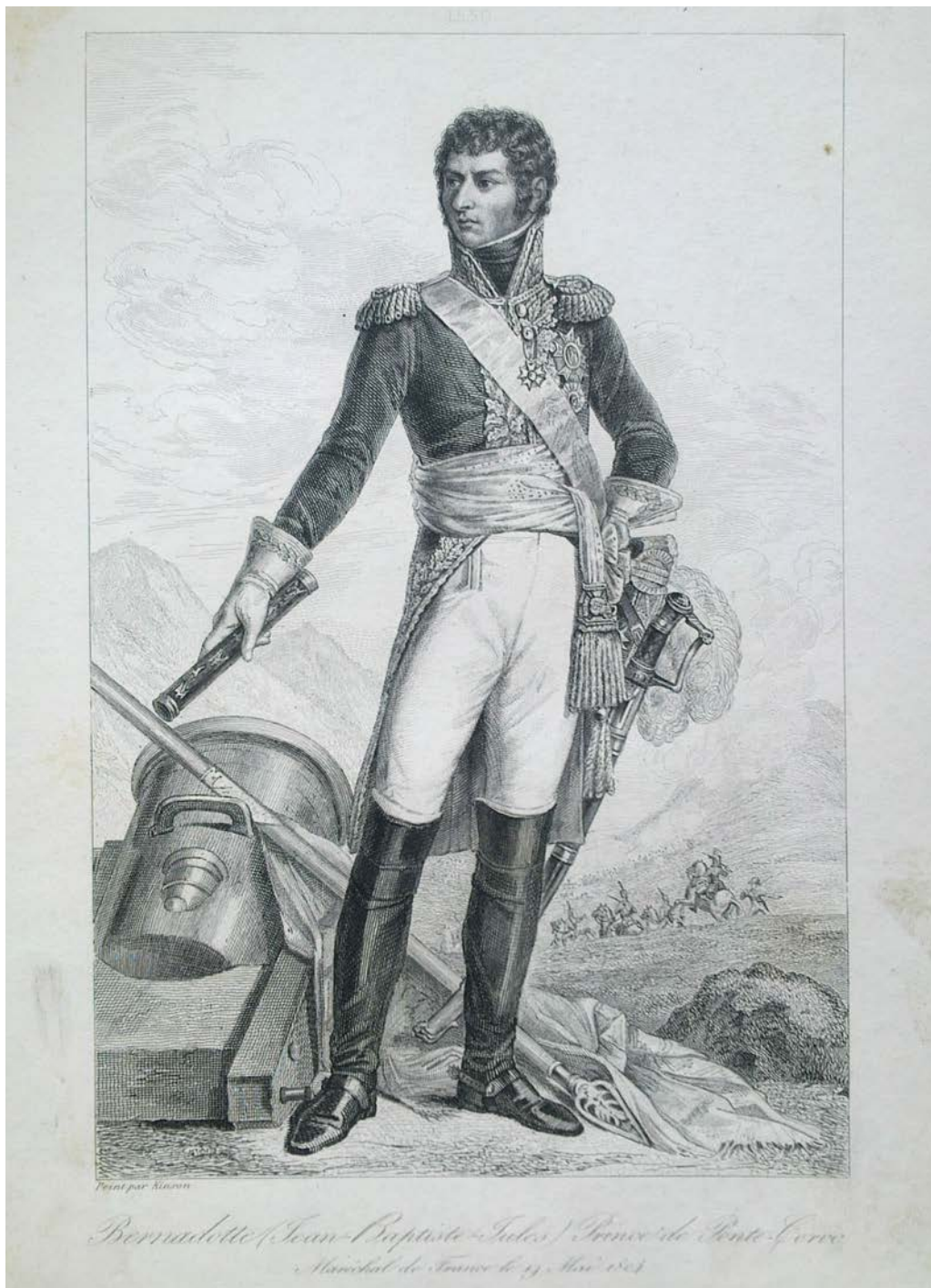
Ил. 2. Жан Батіст Жюль Бернадот (фр. Jean Baptiste Bernadotte ; 1763–1844).