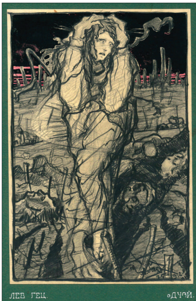
Лл 3. Гец Л. Одчай. Папір, олівець, акварель

Напрацювання Геца поділяються тематично. Твори, присвячені бойовим звершенням і побуту усусівців: «Мандрівка років», «До ясних зір», «Могила», «Morituri», «Отчай», «Пам'ятник», «Стрілецька слава» – змальовують перебіг військових буднів, реалістично передають страшні сцени боїв чи відпочинку бійців-усусівців,