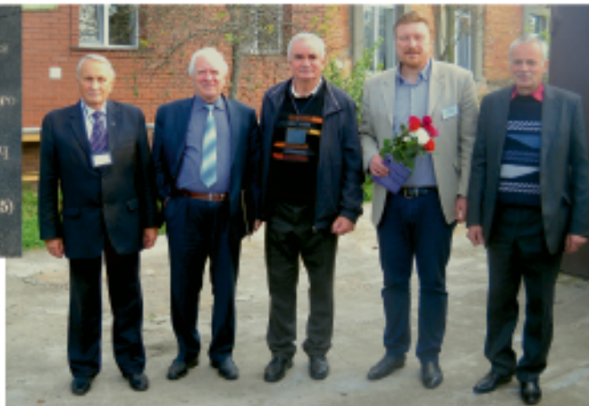
Открытие мемориальной доски на доме, где родился и жил И. С. Шкловский