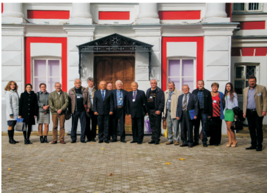
Участники конференции возле здания Глуховского национального педагогического университета им. А. Довженко