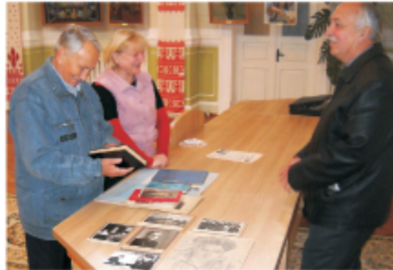
Экспонаты, посвященные И. С. Шкловскому, в краеведческом музее, г. Глухов