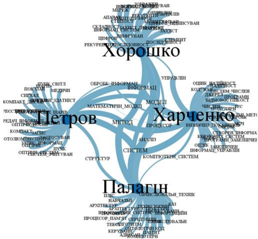
Рис. 3. Мережа термінів одних із найбільш комунікативних науковців з комп'ютерних наук