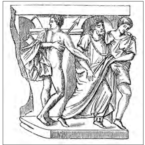
Слепой Эдип удаляется в изгнание

Искусственно сдерживающие индивидуализм тенденции, которые, к тому же, объективно сдерживали становление личности, вероятно, содержали в себе и определенную мифологическую оценку нового явления. Тот, кто стал выше обычной роли сына «Матери-земли» – рода-территории, а также – брата, равного среди равных, мог рассматриваться обществом как превысивший «часть-меру», превратившийся в «целое», «вещь в себе», в «кровосмесителя». Полагаем, что такой была основа возникновения сюжета об Эдипе, сложившаяся задолго до Софокла (V в. до н.э.) 73 . О скотоводческих истоках этой истории, возможно, говорит и особая роль в ней пастухов, спасших