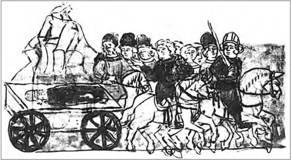
Ослепленного Василька Теребовльского везут «по грудному пути». Миниатюра Радзивилловской летописи

В то же время, позиции двух противных сторон – Давыда со Святополком и Василька с Мономахом, с точки зрения семантики ослепления – вполне солидарны. Для первых – ослепления достоин предавший член рода, оно подчеркивает его асоциальность, для вторых – ослепление одного – травма целого рода. Значит оба мнения совпадают в том, что зрение человека принципиально для всего рода, а слепота, как таковая, представление о «родстве» отрицает.