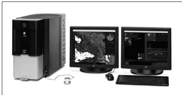
Рис. 1. Внешний вид настольного электронного микроскопа Phenom ProX