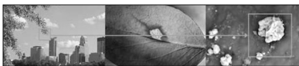
Рис. 2. Предмет исследования: металлические загрязнения на листе дерева в промышленной зоне