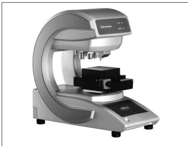
Рис. 10. Микротвердомер SHIMADZU модели HNV-G

ют два новых энергодисперсионных рентгенфлуоресцентных спектрометра EDX-7000 и EDX-8000 . Это идеальные инструменты для неразрушающего элементного анализа, кото-