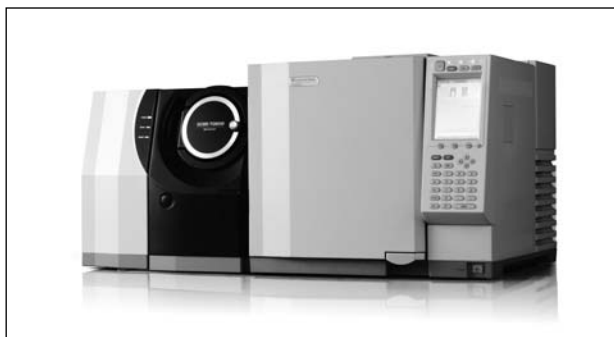
Рис. 4. Газовий хромато-мас-спектрометр з трійним квадруполом SHIMADZU моделі GCMS-TQ8030

но-іонізаційного детектора. Таким образом, при аналізі суміші, що містить як органічні, так і неорганічні компоненти, замість двох детекторів достатньо використовувати один VID-детектор, причому чутливість визначення буде вище. Важливо відзначити також, що конструкція детектора забезпечує відсутність прямого контакту плазми з електродами. Внаслідок цього забруднення електродів зведено до мінімуму, що забезпечує стабільність результатів аналізу.