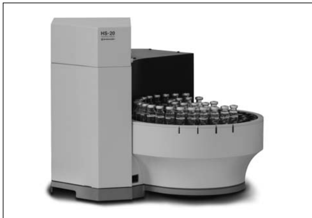
Рис. 3. Автодозатор парової фази SHIMADZU моделі HS-20