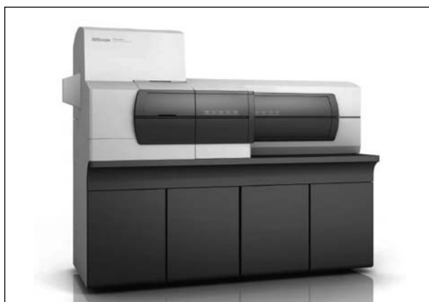
Рис. 6. Визуализирующий масс-микроскоп SHIMADZU модели IMScope