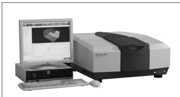
Рис. 7. ИК-Фурье спектрофотометр SHIMADZU модели IRTracer-100

рометром может быть использован ИК-микроскоп модели AIM-8800.