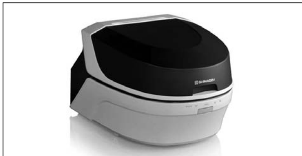
Рис. 8. Энергодисперсионный рентгенфлуоресцентный спектрометр SHIMADZU модели EDX-8000