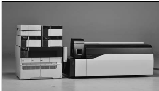
Рис. 1. Жидкостный хромато-масс-спектрометр с тройным квадруполем SHIMADZU модели LCMS-8050

Для специалистов, применяющих в своей работе газовые хроматографы, несомненный интерес должен представить новый хроматограф SHIMADZU с универсальным детектором, использующим ионизацию определяемых компонентов в низкотемпературной гелиевой плазме барьерного разряда (температура плазмы близка к комнатной). В соответствии с природой плазмы новый детектор получил название BID (Barrier discharge Ionization Detector) , а газовый хроматограф, представляющий собой