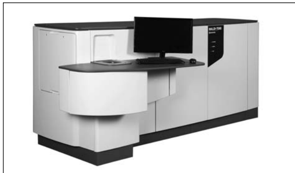
Рис. 5. Масс-спектрометрическая система SHIMADZU модели MALDI-7090

Из новых разработок в области оптической спектроскопии следует отметить ИК-Фурье спектрофотометр IRTracer-100 (рис. 7). Этот высокоскоростной высокочувствительный прибор предназначен для решения широкого круга исследовательских и прикладных задач. Использование детектора МСТ и программного обеспечения Rapid Scan позволяет выполнять запись спектров со скоростью 20 спектров в секунду, что открывает широкие возможности в области кинетических исследований. Спектральный диапазон составляет 240–12500 см -1 . Разрешение может быть установлено в пределах 0,25÷6 см -1 . Соотношение сигнал/шум, превосходящее 60 000 : 1, обеспечивает высокую чувствительность аналитических измерений. Для исследования микрообъектов, биопроб, картирования поверхности и т.п. в сочетании со спект-