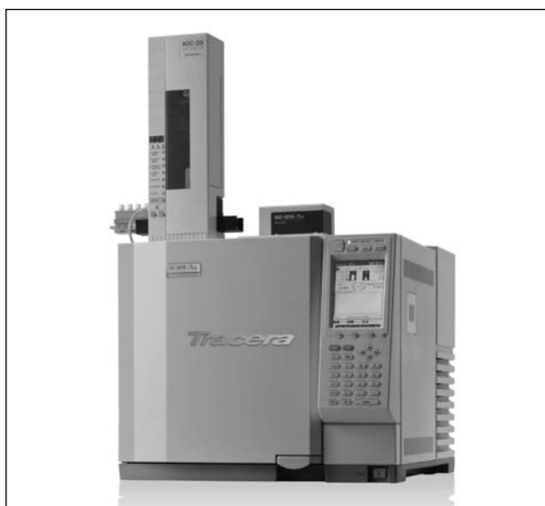
Рис. 2. Газовый хроматограф SHIMADZU модели GC-2010Plus-BID Tracera

систему GC-2010Plus-BID, вследствие высокой чувствительности нового детектора получил название TRACERA (рис. 2).