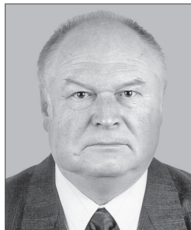
ЗЕНКІН Анатолій Семенович, доктор технічних наук, професор, заслужений діяч науки і техніки України

достойно представляють УТА в Азербайджані, Узбекистані, Росії, Литві, Латвії, Вірменії. Ці видатні вчені — члени УТА — значно сприяють пропагуванню досягнень України за кордоном. Це свідчить про те, що Академія має великий науковий та виробничий потенціал, істотно впливає на створення та впровадження наукомістких технологій і здатна захищати спільні інтереси членів Академії.