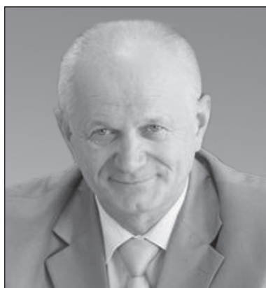
Член президії НОСКО Микола Олексійович, доктор педагогічних наук, професор, дійсний член НАПН України, відмінник освіти України