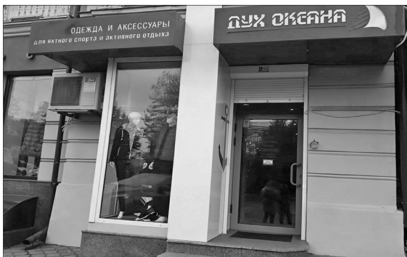
Рис. 3. Наявність зовнішніх блоків кондиціонерів на фасадах будівель: а – торговельна точка з зовнішнім блоком кондиціонера; б – банківські установи з зовнішніми блоками кондиціонерів