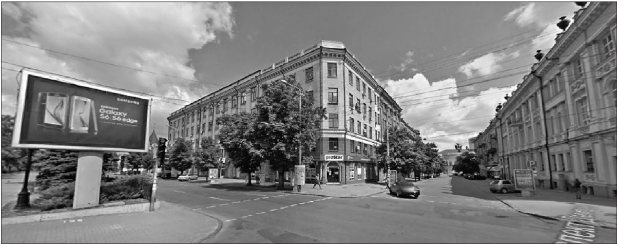
Рис. 1. Перехрестя просп. Д. Яворницького та вул. Воскресенська (фото)

ти результати охорони чистоти повітря і боротьби з шумом, отримані шляхом використання технічних удосконалень, що мають на меті обмеження рівня шуму і зменшення кількості відпрацьованих газів, що виділяються транспортними засобами. Радикальним засобом, що запобігає негативним наслідкам моторизації, є зміна принципів формування транспортних схем і забудови, що застосовувалися донині. Необхідним є істотне просторове відділення територій, призначених виключно, або головним чином, для пішохідного руху (територій центрів), від територій, призначених тільки, або головним чином, для руху транспорту. Транзитний рух слід проводити виключно за межами території центру міста. Це питання детально розглянуто в роботі [13].