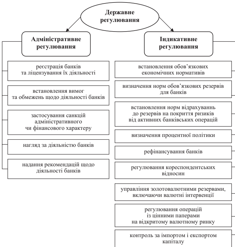
Рис. 4. Державне регулювання діяльності банків, що здійснює НБУ [22, с. 7]

осіб, чи фінансування стратегічно важливого для розвитку економіки проекту, згідно з вимогами НБУ банки здійснюють однакове резервування, мають виконувати однакові обов'язкові нормативи. Такий підхід суперечить політиці держави щодо розвитку інвестиційної діяльності. Національний банк не створює стимулів для банків інвестувати кошти в розвиток реального сектору економіки, а самим банкам головне – отримати вищі прибутки за низького рівня ризиків, що стримує розвиток банківського інвестиційного кредитування.