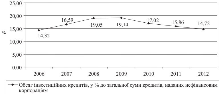
Рис. 2. Динаміка частки інвестиційних кредитів до загальної суми кредитів, наданих нефінансовим корпораціям протягом 2006–2012 років, %

Якщо ж детальніше дослідити, яку частку займають кредити в інвестиційну діяльність до загального обсягу наданих кредитів нефінансовим корпораціям, то можна стверджувати, що вони мали загальну тенденцію до зростання протягом 2006–2009 рр. (рис. 2).