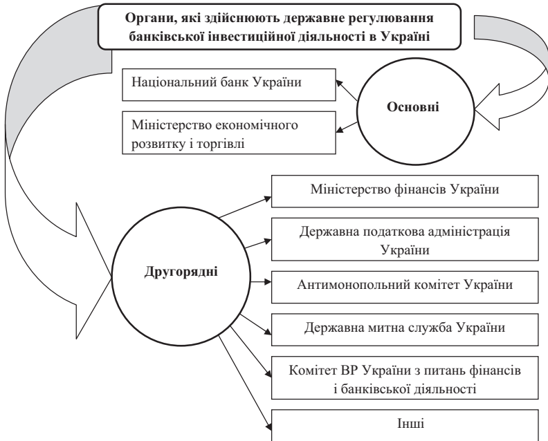
Рис. 3. Органи, які здійснюють державне регулювання банківської інвестиційної діяльності в Україні

економіці. Це означає, що першочергову роль у процесі регулювання інвестиційної діяльності держави відіграє Національний банк України (далі – НБУ). Окрім того, він виступає головним органом державного регулювання макроекономічних процесів за допомогою грошово-кредитних методів [9]. Тому, на нашу думку, потрібно більш детально дослідити вплив НБУ на банківську інвестиційну діяльність.