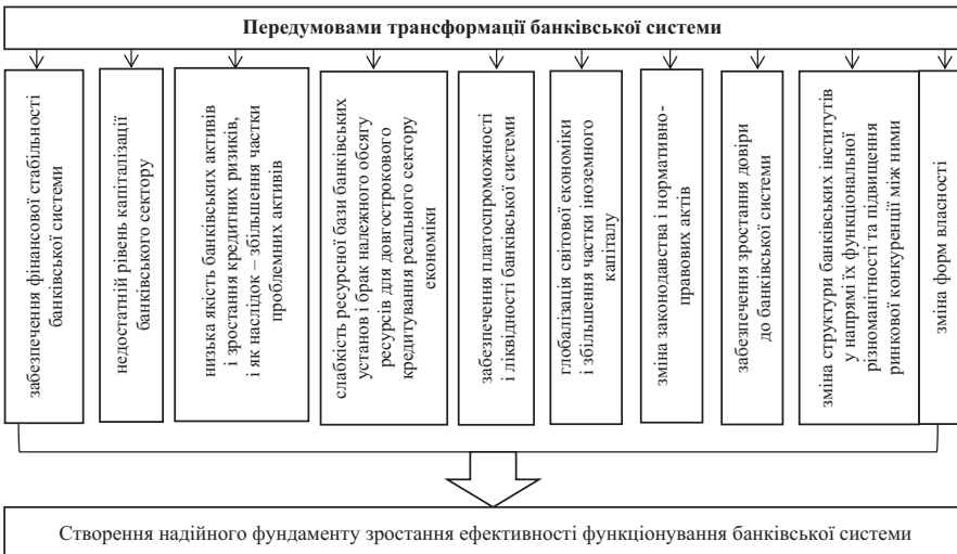
Рис. 1. Передумови трансформації банківської системи

Щодо трансформації банківської системи, то об'єктивні передумови і необхідність проведення трансформаційних процесів у ній зображено на рис. 1 .