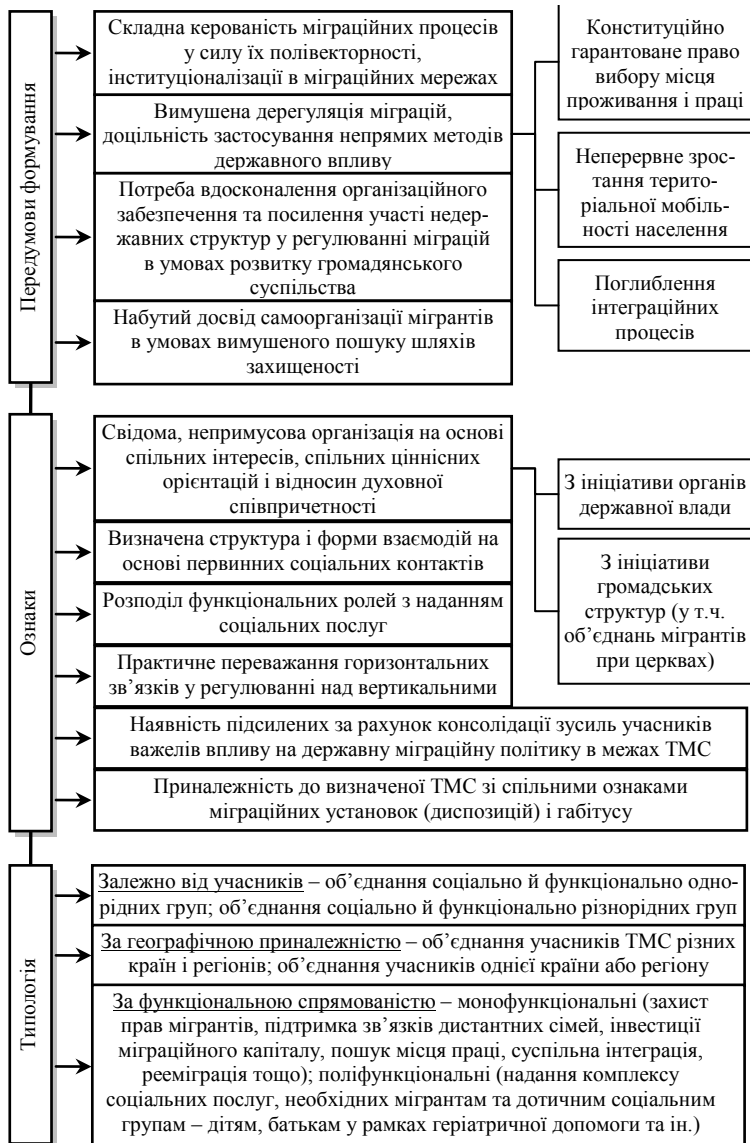
Рис. 2. Основні характеристики соціальних кластерів ТМС (Складено автором)