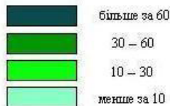
Рис. 4. Співвідношення попиту й пропозиції робочої сили на ринку праці Закарпатської області у 2011 р. (Складено автором на основі джерела: [2])

Навантаження на одне вільне робоче місце, осіб