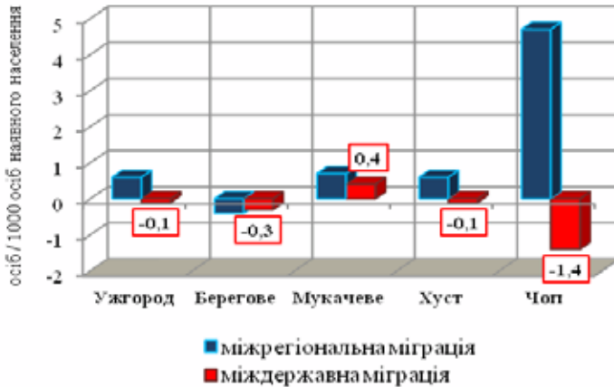
Рис. 2. Коефіцієнти сальдо міграції у містах обласного підпорядкування Закарпатської області, 2011 р. (Складено автором на основі джерела: [2])

починаючи з середини 90-х років ХХ ст., де можливе забезпечення фізіологічних потреб за рахунок особистого підсобного господарства, здебільшого вирішена проблема житлового забезпечення. Проте обмежені можливості працевлаштування, кар'єрного зростання, забезпечення соціальною інфраструктурою знову актуалізують міграційний вектор «із села до міста».