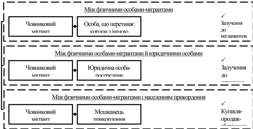
Рис. 2. Типові схеми неформальних економічних відносин човникових мігрантів*

представлених на рис. 1. Часова пролонгованість практики купівлі-продажу в системі малого прикордонного руху призвела до інституціоналізації специфічних типів відносин. На рис. 2 подано основні варіанти відносин між човниковими мігрантами при малому прикордонному русі, що здебільшого відзначають неформальним характером.