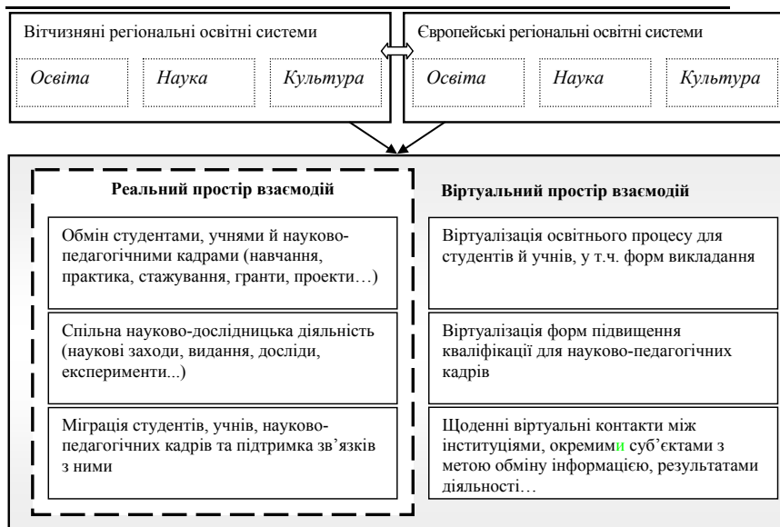
Рис. 1. Простір взаємодій українських та європейських регіональних освітніх систем*