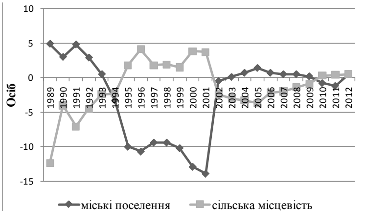
Рис. 2. Сальдо міграції у Львівській області за типом поселень, на 1000 осіб наявного населення, 1989-2012 рр. (Побудовано за: [7])

Проста система рівнянь (1) демонструє залежність сальдо міграції у сільській місцевості від рівня зарплати у сільському господарстві (прямий зв'язок) та рівня зарплати в промисловості (обернений зв'язок).