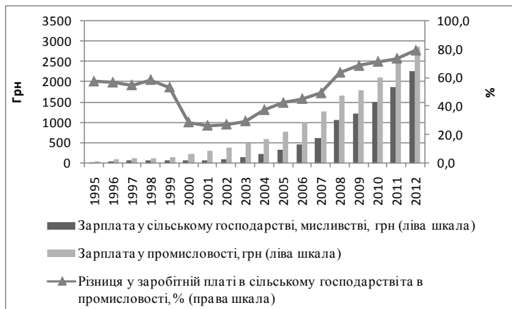
Рис. 3. Динаміка середньомісячної номінальної заробітної плати у Львівській області, 1995-2012 рр. (Побудовано за: [6])

Протилежний вплив рівень зарплати в сільському господарстві та промисловості здійснює на сальдо міграції в міських поселеннях, емпірично підтверджуючи теоретичні положення моделі Тодаро. Для розрахунку використовувались річні дані за 1995-2012 рр. [6; 7].