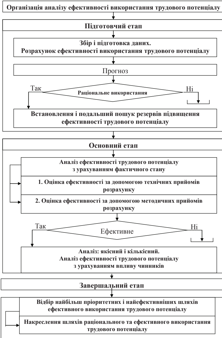
Рис. 1. Деталізована модель організації аналізу ефективності використання трудового потенціалу підприємств