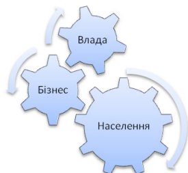
Рис. 1. Концепт збалансованого розвитку регіону

Проект Стратегії збалансованого розвитку Луганської області на період до 2020 р. містить композицію стратегічних, операційних і тактичних цілей (рис. 2.) збалансованого розвитку економіки, які комплексно вирішують проблеми регіонального розвитку області: зменшення значної кількості депресивних територій; зниження маловодності області; усунення занепаду житлово-комунального господарства, невідповідності затрат підприємств житлово-комунального господарства та тарифів, встановлених за їх послуги; усунення розбалансованості схем теплопостачання населених пунктів; зниження енергетичної залежності