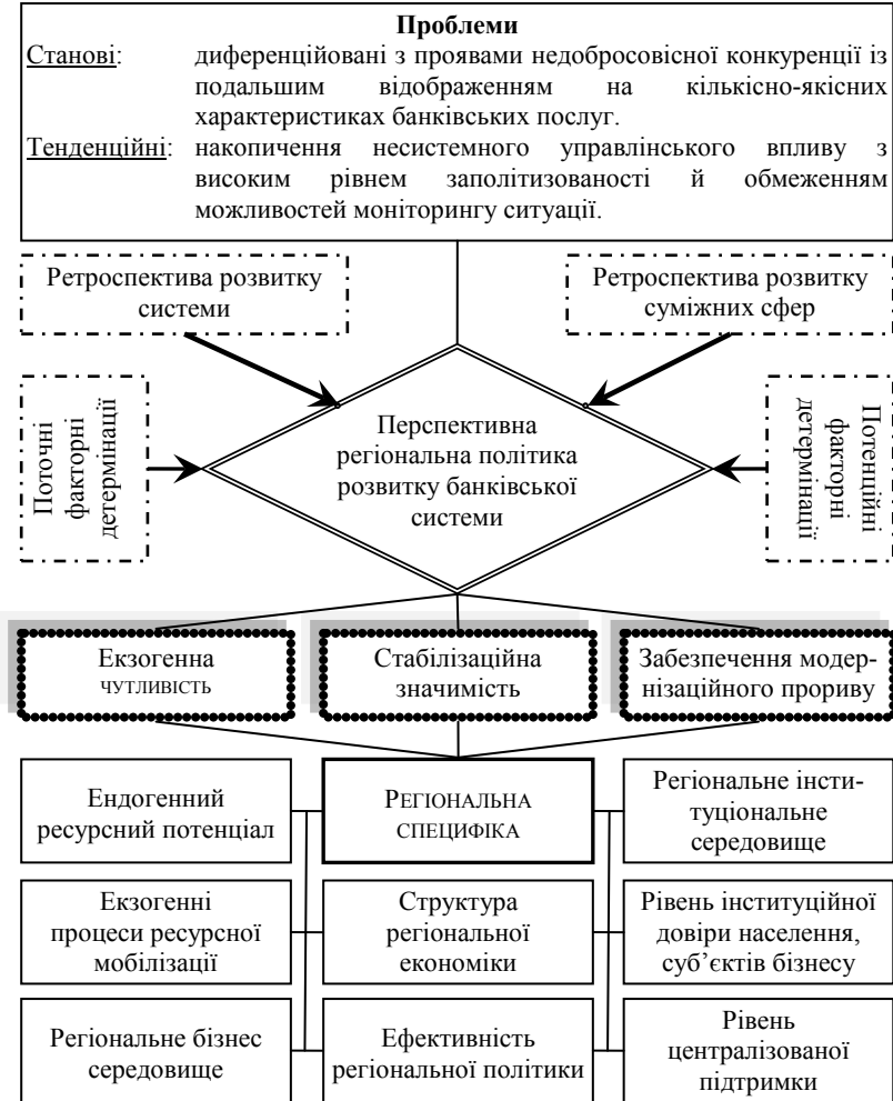
Рис. 1. Передумови та причини реалізації регіональної політики розвитку банківської системи на перспективних засадах